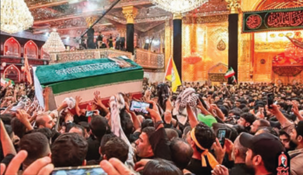
طی دوروز یایانی مراسم تشییع رهبر شهید

انقلاب اسلامی ایران در عراق و در مشهد، رسانه‌های جهان در وهله نخست، خیل جمعیت حاضر را مدنظر قرار دادند و با توجه به چنین حضور گسترده‌ای، ظهور «پیوندهای دینی و سیاسی» و نیز نمود «قدرت سیاسی ایران» را برجسته‌تر کرد. شبکه خبری سی‌ان‌ان با در نظر گرفتن مجموعه این موارد، در تشریح حضور میلیونی مردم عزادار از عبارت «رژه پیروزی» استفاده کرد.