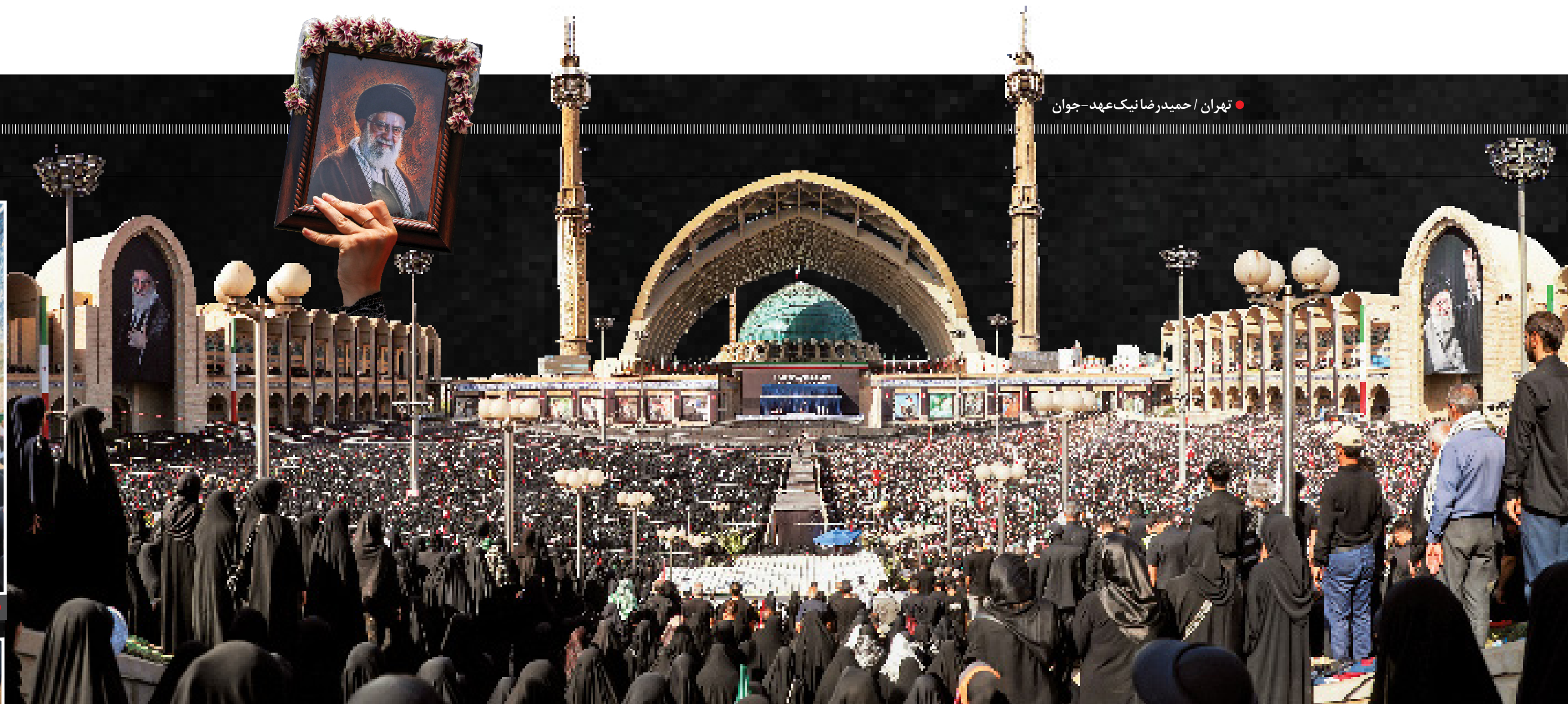
تهران / حمیدرضا نیک عهد - جوان