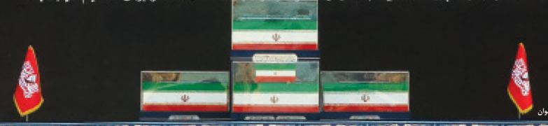
تهران / ارشاد شهری - جوان

یگو شمارا تنها به یک چیز اندرز می‌دهم، و آن اینکه به نگرده نگر با یک نفر یک نفر برای خدا قیام کنید. سی‌ و چهار