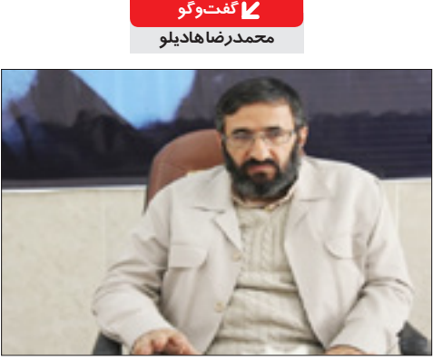
گفت و گو ی «جوان» با رئیس بسیج اساتید چهار محال وبختیاری

دو سوم از هزار عضو هیئت علمی شهر کرد بسیجی اند