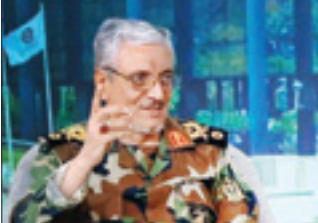
سردار سرلشکر پاسدار «محسن رضایی»

از آن‌واقعی باشد، تبلیغاتی است. سخنگوی ارشد نیروهای مسلح تأکید کرد: ما در میدان عمل پاسخ دشمنان را داده‌ایم و خواهیم داد. شعار، تویت و جنگ روانی هیچ مشکلی را برای امریکا‌حل نخواهد کرد. سردار شکرچی با اشاره به اقدامات امریکا در منطقه تصریح کرد: ترامپ هر جنایتی که مرتکب شده، چندین برابر آن خسارت دیده است و در آینده نیز خسارت‌های بیشتری متحمل خواهد شد. وی در پایان خاطر‌نشان کرد: امروز ترامپ به دنبال راهی برای خروج از این جنگ و بحران هاست و تلاش می‌کند راه فراری آبرومندانه برای خود پیدا کند، اما جمهوری اسلامی ایران اجازه نخواهد داد امریکا و ترامپ به‌صورت آبرومندانه از تبعات اقدامات خود راهی یابند.