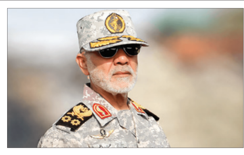
سردار سرلشکر پاسدار «محسن رضایی»

بر خلاف لغافظی‌ها و ه‌ه‌ارت و پورت‌هایی که طسرف امریکایی، در فضایی مجازی علیه جمهوری اسلامی ایران به راه انداخته است، واقعیت میدانی حکایت دیگری دارد. این را می‌توان در مواضع رسمی و غیر رسمی فرماندهان تیر و هوای مسلح در یافت. جایی که فرمانده قرار گاه مرکز خاتم‌الانبیا از شنیدن شسدن ظنین پیروزی ایران گفت و محسن رضایی از جهش قدرت ایران در جهان در پرتو جنگ رمضان یساد کرد. از این‌رو بود که سخنگوی ارشدد نیروهای مسلح هم در محسن رضایی از جهش قدرت ایران در جهان در پرتو جنگ رمضان یساد کرد. و احاد زرمندگان و مدافعان غیر تمند وطن در سراسر مرزهای آب، خاکی و هوایی کشور با روحیه «ما می‌توانیم» و بهره‌گیری از تجهیزات پیشرفته و بومی، مظهر بازدارندگی فعال و صلابت ملی هستند. ما ادامه‌دهندگان راه شهید رشید کاملاً آگاهیم که امنیت و آرامش امروز ایران اسلامی م‌ر هوون مجاهدت‌های خاموش و شوبه‌نداری‌های فرماندهان دلسوز و خستگی‌ناپذیری چون شهید رشید است که تا آخرین لحظه حیات، مشغول طراحی و تحمیل قدرت‌سازی دفاعی و بازدارندگی برای کشور بوده‌اند. بی تردید ملت وقادار و قدرشناس ایران اسلامی با تاسی به سیره و منش شه‌های اقتدار ایران اسلامی، بویژه شهید پاسدار شهید غلامعلی رشید تحت تدابیر و منویات خلف صالح امام شهید، رهبر عظیم‌الشأن انقلاب اسلامی و فرماندهی معظم کل قوا ایت‌الله سیدمجتبی حسینی‌خامنه‌ای همانند همیشه استوار و پا بر جا در میدان، پشتوانه نخستین مسلح در برابر تهدیدات دشمنان به خصوص در شرایط خطر جنگ سوم تحمیلی امریکایی صهیونی بوده و به فضل الهی جهانیان به زودی ظنین پیروزی ایران و ایرانی و غلبه مقاومت بر دشمن متجاوز و ترویرست در پهنه گیتی را خواهد شنید.»