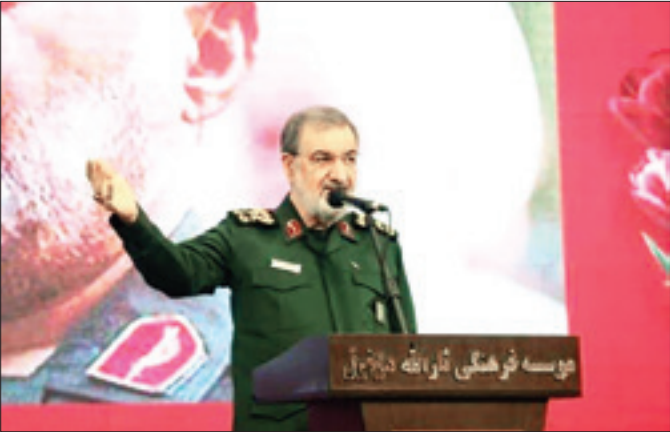
سردار سرلشکر پاسدار «محسن رضایی»

عبداللهی اضافه کرده است: «شهید رشید، نه فقط یک فرمانده میدانی که یک مکتب در عرصه دفاع و امنیت ملی بسود، او که در دوران دفاع مقدس به عنوان یکی از معماران اصلی عملیات‌های غرورآفرینی نظیر فتح‌المصلی، ژئوپلیتیک و تحلیل‌های عمیق معادلات بعثت دوباره ه مردم ایران شده است و این نبرد تا نجات بشریت ادامه دارد. وی افزود: ملت امریکا امروز با لایه‌ی گری و نفوسد در ارکان تصمیم‌گیر ایالات متحده امریکا به مستعمره اسرائیل تبدیل شده است. فرمانده سپاه پاسداران در دوران دفاع مقدس تصریح کرد: ایستادگی در مقابل امریکا و اسرائیل از طرفی موجب نجات ایران از فشار، تهدید و تجزیه و از طرفی مبارزه با شسورزترین