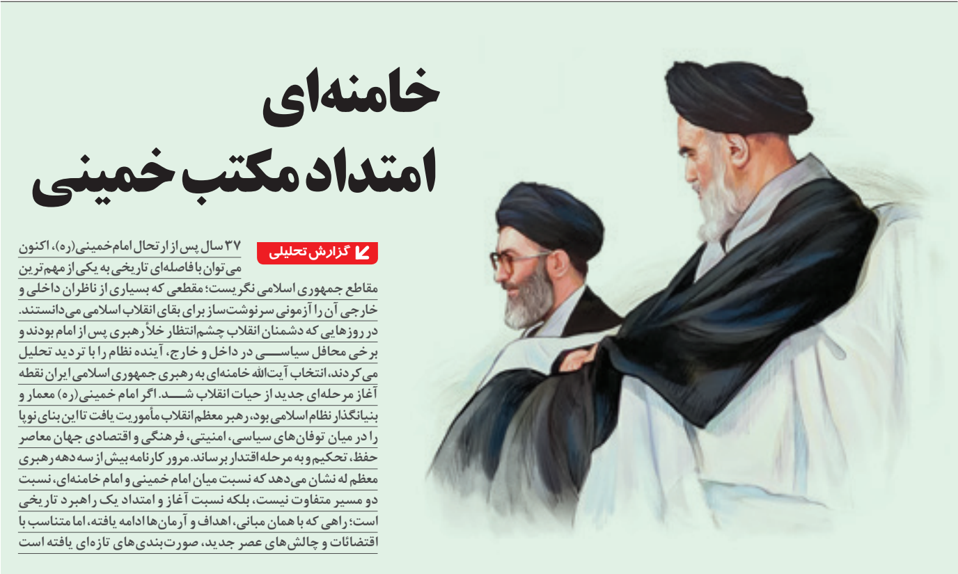
روحانوتوانایی رهبری را از خود دور کرده‌اند. رهبران انقلاب اسلامی در دوران معاصر، با استفاده از ابزارهای تبلیغاتی، توانسته‌اند تا با استفاده از ابزارهای تبلیغاتی، مردم را به پیروی از خود متقاعد کنند.

رحلت امام خمینی(ره) در خرداد ۱۳۶۸ تنها پایان زندگی جسمانی بنیانگذار جمهوری اسلامی نبوده،آغاز یکی از حساس‌ترین آزمون‌های تاریخ انقلاب اسلامی نیز محسوب است. در آن مقطع، کشور هنوز از تبعات جنگ تحمیلی فاصله نگرفته بود،اقتصاد در شرایط دشواری قرار داشت و بسیاری از جریان‌های معارض داخلی و خارجی، دوران پس از اسام را بهترین فرصت برای ضربه زدن به نظام اسلامی ارزیابی می‌کردند. در فضای سیاسی آن روزها، این پرسش جدی مطرح بود که آیا شخصیتی خواهد توانست جایگاه رهبری امام را در هدایت انقلاب حفظ کند یا خیر. عظمت شخصیت امام خمینی(ره)، نقش بی‌بدیل ایشان در پیروزی انقلاب و مدیریت بحران‌های دهه نخست جمهوری اسلامی باعث شده بود بسیاری تصور کنند خلأناشی از فقدان ایشان قابل جبران نخواهد بود.اما انتخاب حضرت آیت‌الله خامنه‌ای از سوی مجلس خبرگان رهبری، فصل تازه‌ای در تاریخ جمهوری اسلامی گشود.فصلی که امروز با گذشت بیش از سه دهه، امکان ارزیابی دقیق‌تر آن فراهم شده‌است.