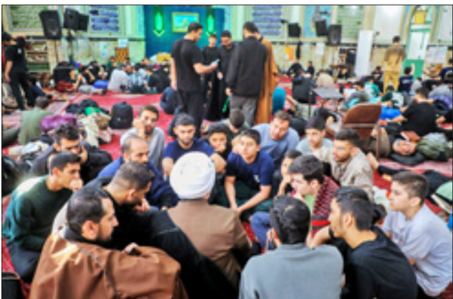
میدان شایگان تهران