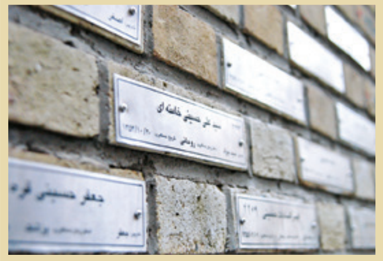
پلاکی متعلق به نام امام شهید، در میان نام هزاران زندانی کمیته مشترک ساواک

ایشان... این خط پار یک نور، همان «وعده صادق» الهی است».