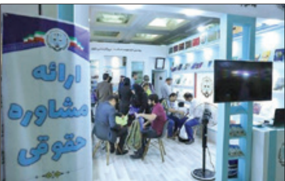
برنامه محله‌محور و آموزشی با حضور قضات، کارکنان، وکلای کارشناسان، اساتید دانشگاه، اعضای شوراها و حل اختلاف، داوران، میانجیگران و خادم‌یاران رضوی در سطح استان در حاشیه اجتماعات مردمی اجرا شده است.