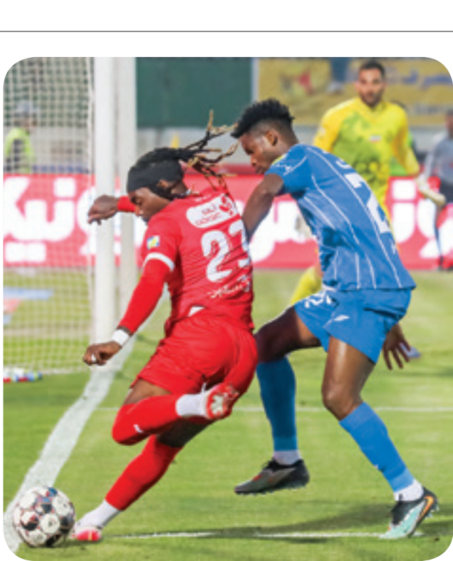
مدیرکل باشگاه جوان