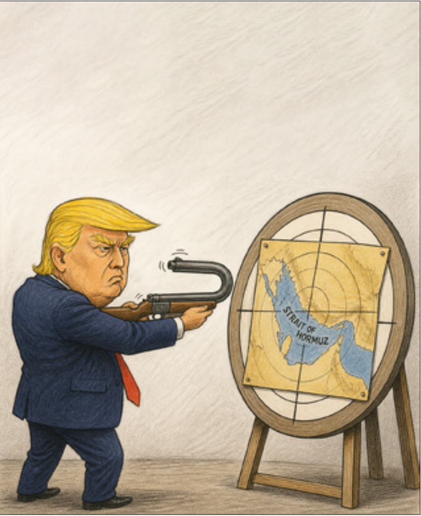
حسین کشنگار، تهران