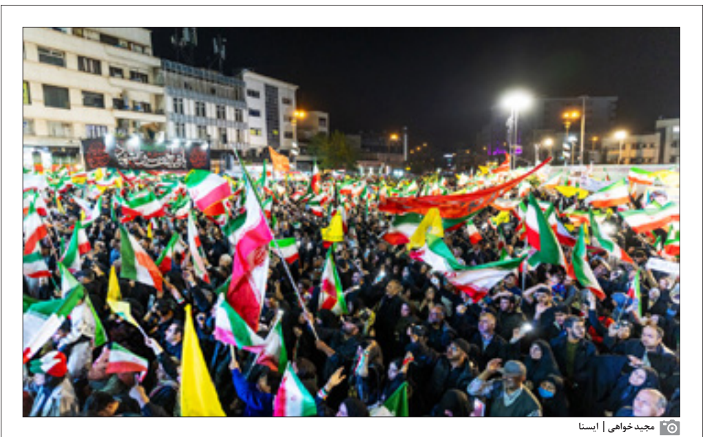
مجید خواهی ایسا

آنچه امروز هویداست، این است که بعثت و رستاخیز مردمی با انگیزه الهی، توانسته بسیاری از معادلات جنگی را به نفع ایران تغییر دهد و با نمایاندن قدرت درونی به دشمنان، سدی که حضوری آگاهانه و مستمر در میدان‌های مختلف می‌طلبد و خوشبختانه حضور پرشور مردم در خیابان‌ها نشان داد که با وجود فشارهای فزاینده، روحیه صبر راهبردی و مقاومت فعال در بطن جامعه جاری است و مردم همچنان حامیان مستحکم میدان نظامی و عرصه نبرد هستند.