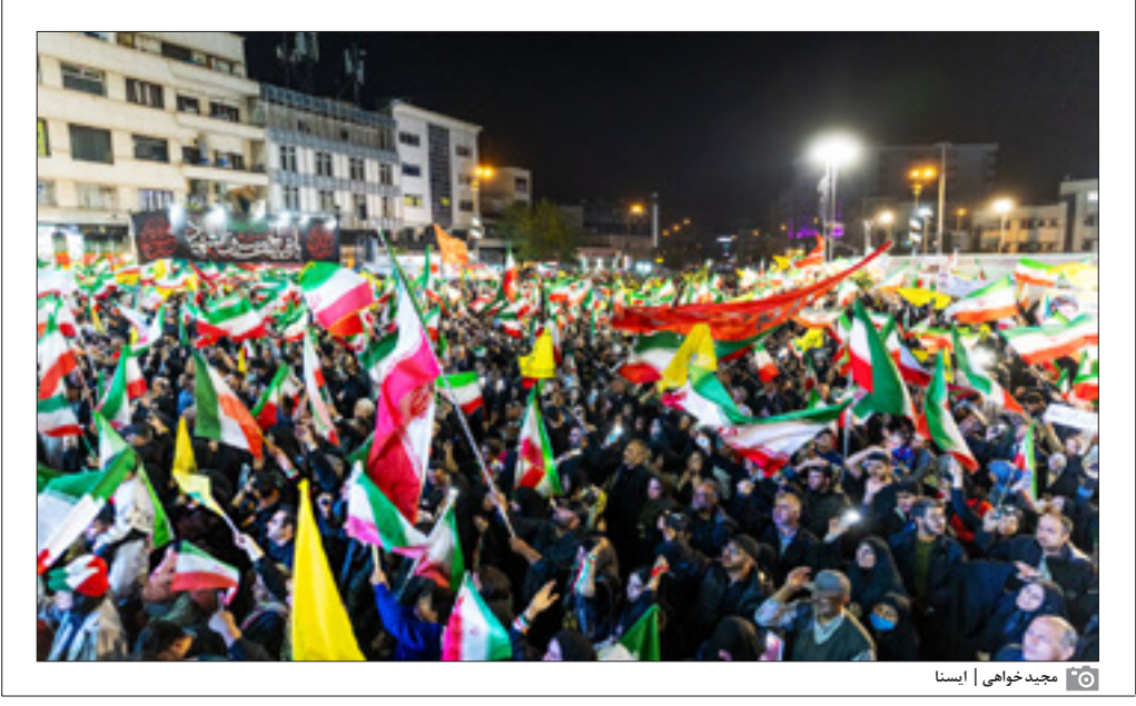
مجید خواهی ایسا

ماه نقطه اتکایی بود که توانست راه‌اندازی یک آشوب داخلی را در میانه جنگ سهل‌الوصول کرده و مسیر جنگ را به سمت داخل تغییر دهد. از این جهت هزینه‌های سیاسی و اقتصادی برای امریکا و رژیم صهیونیستی کاهش پیدا کرده و مستزل می‌گردد، اما این نوع تنوریزه کردن جامعه ایرانی با خطای بسیار فاحش و بزرگی همراه بود و نشان داد که تصمیم‌گیران آمریکایی درکی از ماهیت جامعه ندارند.