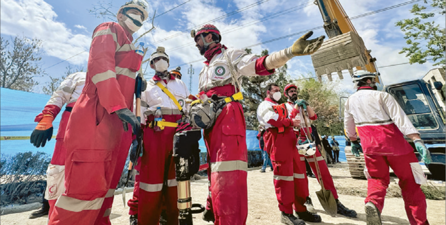
گزارش یک زهراچندری