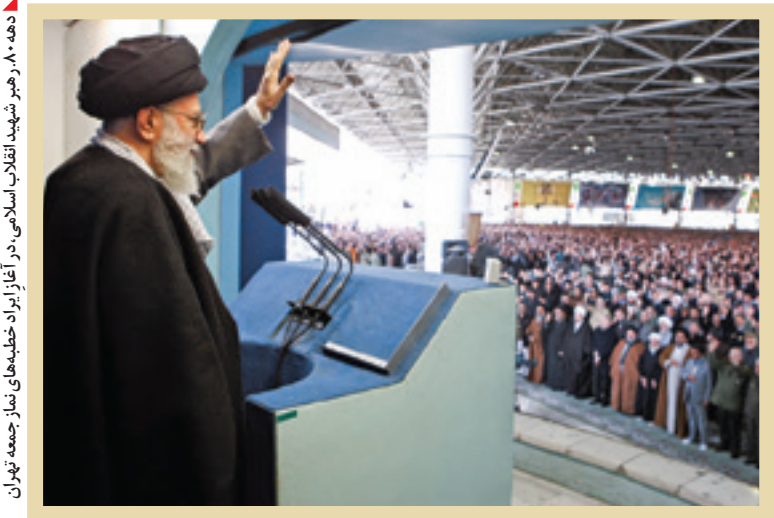
در آستان قدس

سخنان و هدایتگری‌های امام شهیدان را، که در لابه‌لای صفحات دفترچه یادداشت‌های ۲۷ سال گذشته‌ام نگاه می‌کنم، یک مسئله بیش از مسائل دیگر توجه‌ام را جلب می‌کند؛ اینکه «حضرت آقا» با رهنمودهایش ما را تربیت کرد. او رهبری بود که هم روحیه دینی و ایمانی را، روز به روز و سال به سال در وجود مردم زنده‌نگه می‌داشت و آن را تقویت می‌کرد و هم در ابعاد اداره کشور و حفظ آن از انحرافات و خطرات و راه را رسیدن به اهداف، هدایت‌مان می‌کرد. اصلاً برای همین قبل از شهادت فرمود: «مردم ایران درس‌های شیعی خود را بلد هستند». در واقع او در طول سالیان رهبری‌اش، مردم ایران را از مسیری بسیار دشوار و صعب، مر حله به مرحله عبور داد و به ما آموخت که باید برای پیشرفت چگونه بکوشیم و برای رسیدن به قله و برپایی تمدن نوین اسلامی و نهایتاً نیل به ظهور؛ چه مسیری را طی نماییم. اگر درس‌هایی که حضرت آیت‌الله العظمی شهید سیدعلی خامنه‌ای در طول ۳۷ سال رهبری‌اش به ما آموخت، را مداوم مرور کنیم و به عمل آوریم؛ قطعاً به آن قله‌ای که برایمان تصویر کرده است، می‌رسیم و چنین باد.