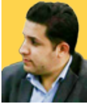
وجدعظیم‌نیا دبیر گروه اقتصادی

رژیم تروریستی امریکا در ادامه سیاست‌های تجاوز کارانه خود علیه کشورمان، ادعای آغاز محاصره دریایی ایران را مطرح کرده است. هدف آشکار از این اقدام، اعمال فشار اقتصادی و آادار کردن سرزمین کهن ما به تسلیم است! اما به پشتوانه مقاومت جانانه مردم و بازوان توانمند نیروهای مسلح و