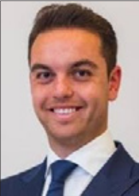
اسپنسر حکیمیان، تحلیلگر امریکایی امور ایران

هری‌سیسون، اینفلوئنسر امریکایی: «توافق ترامپ با ایران خیلی وحشتناک به نظر می‌رسد. آنها کنترل کامل تنگه هرمز را به دست می‌آورند، همه تحریم‌ها لغو می‌شود، اورانیوم و موشک‌هایشان را نگه می‌آورند؛ پس هدف از جنگ چه بود؟؟؟» بن سبطی، سخنگوی سابق نخست‌وزیر رژیم صهیونیستی در امور ایران، آمد: «حرف‌نظام ایران پیروز شد. ایران با دست‌بالا از این جنگ بیرون آمد. در تنگه هرمز، آنها می‌توانند کشتی‌های عبوری پول دریافت کنند. در دست است که بازارهای سهام صعود کرده‌اند، اما هزینه آن در آینده بسیار سنگین خواهد بود.» اسکای‌نیوز: «اگر توافق بر سر همین طرح مشخص ۱۰ گانه باشند، این یک «شکست راهبردی عظیم» برای امریکا محسوب می‌شود؛ اما آنها نمی‌خواهند به‌کونای به نظر برسند که گویی در برابر ایران تسلیم شده‌اند.» دنیل ویت‌مور، کارشناس جمهوری خواه، در یادداشتی تأکید کرد: «ایالات متحده از ابتدا نیز تمایل چندانی به ادامه جنگ نداشت. اکنون دولت امریکا به دنبال یافتن راهی برای خروج از این وضعیت است.»