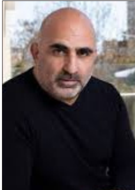
آلون میزراحی، تحلیلگر امنیتی اسرائیلی