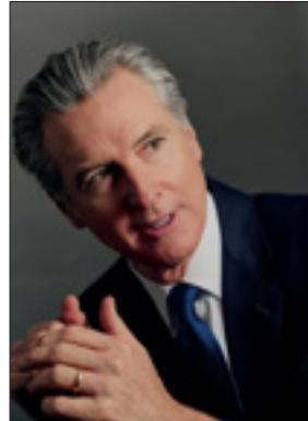
گوین نیوسام، فرماندار کالیفرنیا

مشخص می‌شود که هیچ پیروزی در کار نبوده است.» آدام کینزی‌نگر، نماینده سابق جمهوری خواه کنگره امریکا، گفت: «توافق آتش‌بس، بزرگ‌ترین تحقیر در تاریخ امریکاست.»