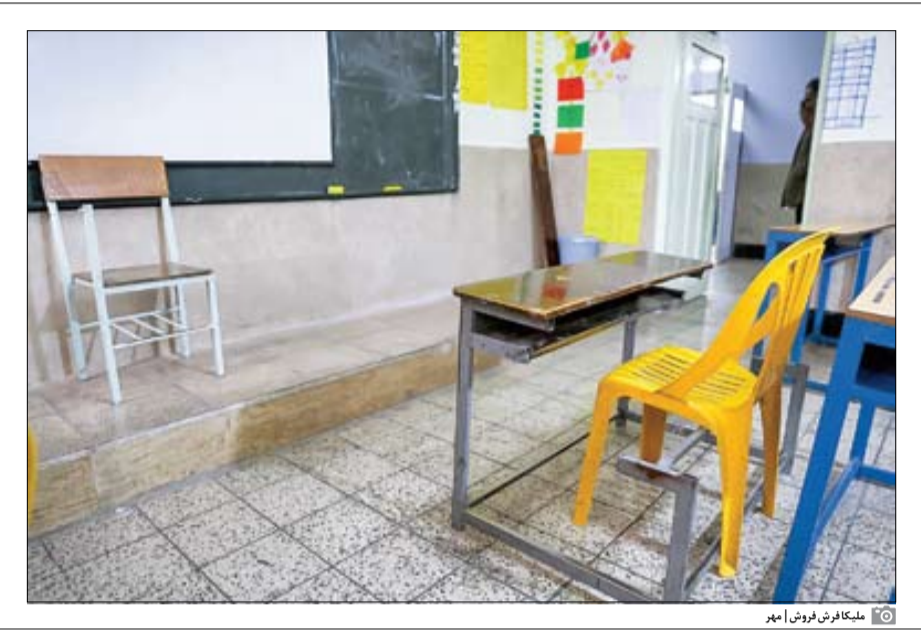
ملک‌افرش فروش امیر

رأ «نگران‌کننده» خواند و از وزیر خواست تا «برنامه‌های منسجم و عملیاتی» برای عبور از این بحران ارائه کند.