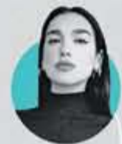
دوآ لپا Dua Lipa

انتقاد از سیاست‌های اسرائیل، درخواست تحریم بین‌المللی اقدامات آپارتاید.