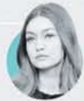
جی جی حدید Gigi Hadid