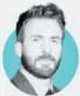
کریس ایوانز Chris Evans