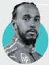
لوییس همیلتون Lewis Hamilton

سازمان‌های خیریه، انتشار پست حمایت از مردم غزه، رد تعویض پیراهن با بازیکنان اسرائیلی.