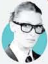
بلا حدید Bella Hadid