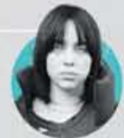
بیلِ ایلِش Billie Eilish

درخواست کمک برای سازمان‌های امدادی، هشدار درباره بحران انسانی در غزه.