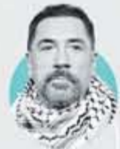
خاویر باردِم Javier Bardem