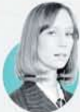
هاننا اینبایندر Hannah Einbinder