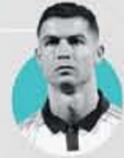
کریستیانو رونالدو Cristiano Ronaldo

بیش از ۱۰,۰۰۰ هنرمند و ورزشکار مطرح جهان به اتفاقات غزه واکنش نشان دادند و به حمایت علنی از فلسطین پرداختند. در این اینفوگرافیک به برخی از مهم‌ترین چهره‌ها می‌پردازیم.