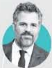
مارک رافالو Mark Ruffalo

«Palestine»، انتشار پیام حمایت از مردم فلسطین، آگاهی‌بخشی درباره خشونت‌ها در غزه.