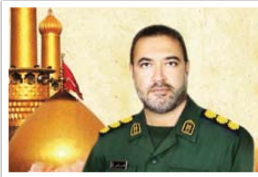
شهید محسن قلمی