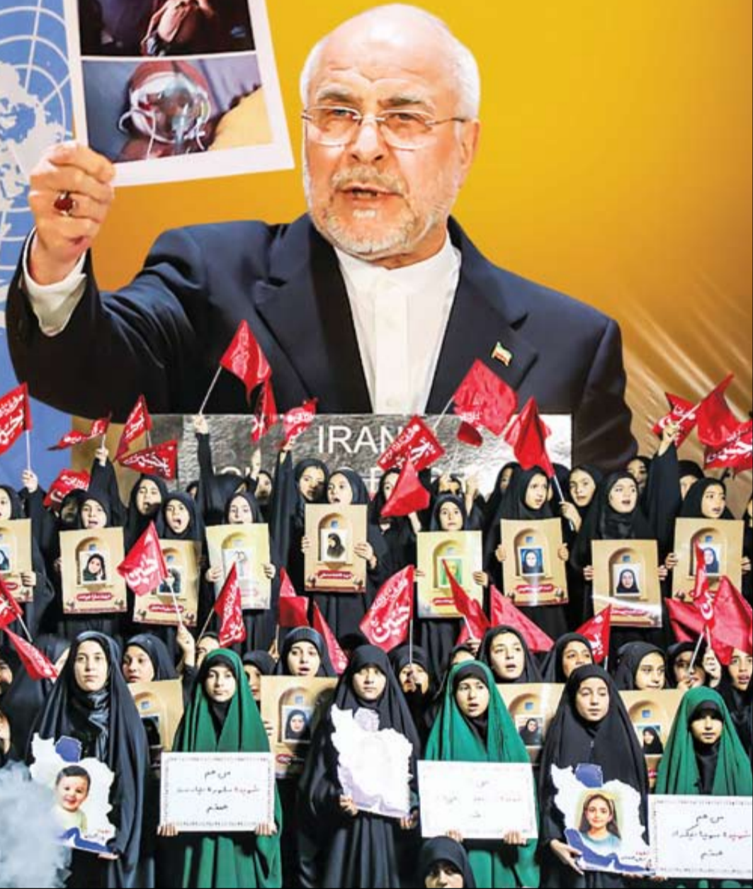
پاسداشت ۱۱۰ کودک و بانوی شهید پایتخت | محمد مهدی صفی | آوان