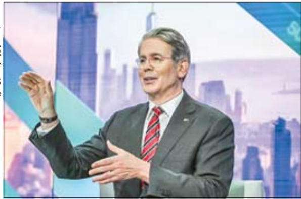
اسکات بسنت، وزیر خزانه‌داری امریکا

منی‌کند: «زونگ یی وو، سفیر چین در تهران در گفت‌وگو با ایسنا درباره اعمال فشار واشینگتن به یکن در صورت خرید نفت از ایران و روسیه اظهار کرد: «به‌طور ساده به این پرسش پاسخ می‌دهم که تجارت بین چین و ایران یک تجارت عادی است؛ یعنی این تجارت عادی نباید تحت تحریم یکجانبه سرف باشد.» بنابراین ترجیح می‌دهند تعرفه ۱۰۰درصدی همین دلیل با هژمونی و یکجانبه‌گرایی به خصوص تحریم‌های یکجانبه‌گرایی امریکا مخالفت می‌کنیم. تجارت عادی چین و ایران تحت تأثیر منفی این عامل قرار نمی‌گیرد.»