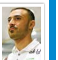
فرهاد نظری افشار ملی‌پوش سابق والیبال