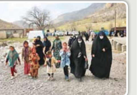
خدمات‌رسانی گروه‌های جهادی در مناطق کم‌برخوردار