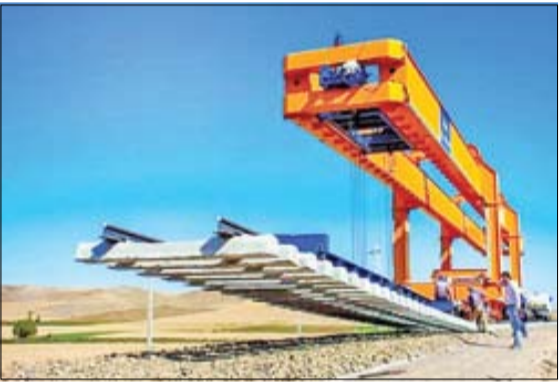
مدت زیادی از تبدیل شدن منطقه مرزی خسروی و شهرستان قصر شیرین به عنوان منطقه آزاد نگذشته است. اتفاقی که می‌تواند نقش مهمی در فرآوری و ارزش افزوده کالاها و صادراتی و وارداتی داشته باشد. در این میان راه‌اندازی پروژه راه آهن کرمانشاه - خسروی نه تنها به توسعه حمل‌ونقل، بلکه به رونق اقتصادی و رشد صنایع در مناطق مرزی کمک می‌کند. مسیر اتصال ریلی از کرمانشاه تا بغداد در مجموع شامل سه بخش است.

مسیر ۲۶۳ کیلومتری از کرمانشاه تا خسروی در داخل ایران و ۲۷ کیلومتری تا خسروی تا خانیسن و ۱۸۲ کیلومتری تا خانیسن تا بغداد در خاک عراق قرار دارد. مجموع طول این مسیر به ۴۷۲ کیلومتری می‌رسد که عملیات اجرایی بخش کرمانشاه تا خسروی از حدود نیم قرن پیش آغاز شده و تاکنون نزدیک ۴۰ درصد پیشرفت فیزیکی داشته است. با این حال وزیر راه دولت چهاردهم اعلام کرده تا دو سال آینده این پروژه نهایی شده و به بهره‌برداری خواهد رسید و چشم‌خیزی‌ها در ایران و خارج، منتظر عملی شدن آن است.