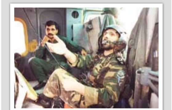
پدرم در حال نشستن در هواپیما

اینها دشمن هستند به خلبان‌ها گفتیم: «هور بزیند و گرنه ما