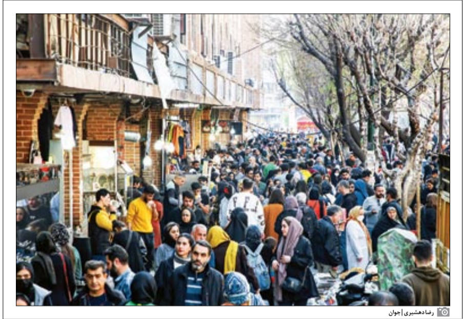
رفاه‌مندی شهری | جوان

افزایش در آمد خانوارهای شهری و روستایی بیشتر از رشد هزینه‌ها بوده است، اما تفاوت‌های استانی و دسترسی به لوازم زندگی و سوخت، چالش‌های اقتصادی و اجتماعی را برای سیاستگذاران و خانواده‌ها حفظ کرده و نیاز به برنامه‌ریزی دقیق برای کاهش نابرابری‌ها و حمایت از خانوارهای کم‌درآمد را آشکار می‌کند