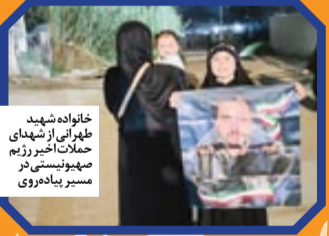
خانواده شهید طهرانی اخیر رژیم صهیونیستی در مسیر پیاده روی

چون آنجا خلوت تر بود. بچه ها می دانستند شرایط چقدر سخت است، اما خدا را شکر باز خودرها و کمکها خیلی خوب بود. این سفر برای من خیلی راحت تر از سفرهای قبلی اربعین بود، به خصوص که بچه شش ماهه همراهمان بود. احساس می کنم همسر خیلی کمک کرد و همچنین کمک امام حسین (ع) و حضرت زهر (س) را همراه داشتیم. خدا را شکر سختی زیادی نکشیدیم. او در ادامه می گوید: «من در این سفر معنوی صحنه های زیبایی را دیدم. من کسی را دیدم که کمرش کاملاً خمیده بود، شاید بیش از ۱۰۰ سال داشت. دقیق نمی دانم، اما مطمئتم که در این مسیر پیاده روی خیلی افراد مسن حضور دارند که هم به دیگران کمک می کنند و هم پیاده روی می کنند. کاری که انجام می دهند، فراتر از توان یک انسان معمولی است.» در سفر اربعین اتفاقاتی می افتد که واقعاً انجام شدنش فقط به لطف و کمک اهل بیت، مخصوصاً امام حسین (ع)، ممکن است. به نظر من