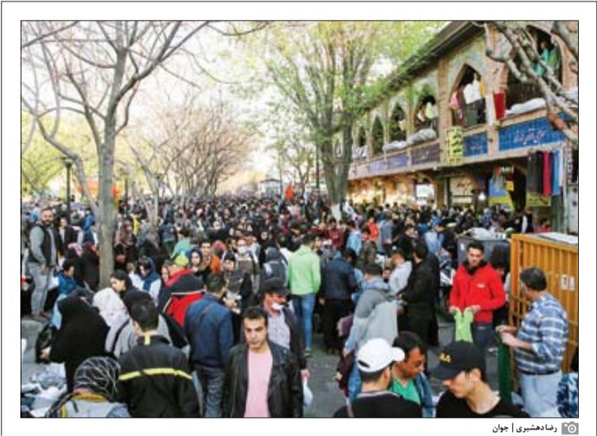
رهامدهشیری ا جوان