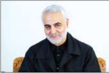
شیخ مرتضی با درج تصویری از شهید سلیمانی نوشت:

سید محمد حسینی بهشتی، در مکتب قرآن، ج. ۲، صص ۲۸–۲۷