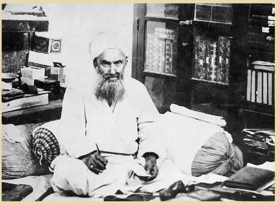
شهید آیت‌الله شیخ فضل‌الله نوری در کتابخانه منزل شخصی

در وصف شخصیت حاج شیخ فضل‌الله، همین بس که مرحوم میرزای بزرگ وقتی ایشان را به تهران می‌فرستد، به او می‌گوید: «حاج شیخ! می‌دانم وجود تو در اینجا لازم است، ولی الان ایران بیشتر به تو احتیاج دارد. من با فرستادن تو، گویی پارهٔ تن خودم را از خود جدا می‌کنم!». یعنی حاج شیخ را برای حفاظت از ایران فرستاده بود. یاد می‌آید یک بار در محضر پدرم، راجع به مقامات علمی آیت‌الله حاج شیخ فضل‌الله نوری صحبت شدند. ایشان ۱۴ شاگرد و برشمرند. من به طفیل پدر، زیاد به محضر شیخ می‌رسیدم و از تباط ما با شیخ ارتباط خانوادگی بود.