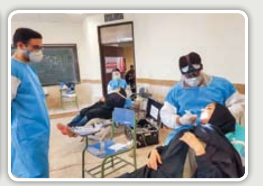
جهادگران تخصصی در مناطق محروم خدمات رایگان ارائه کردند