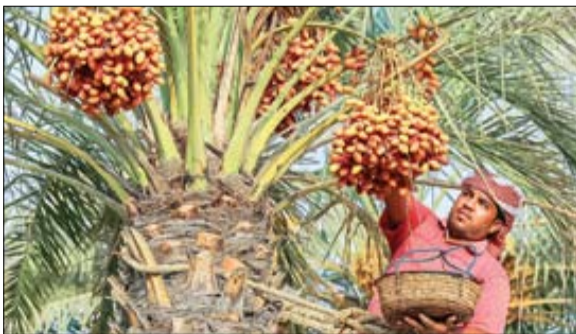
مدیرعامل شیپایی | امیران

ترامپ که قصد داشت جنگ او کر این را از طریق روابط حسنه و هم تایی روس خود پایان دهد، با گذشت چند ماه از تصدی قدرت در کسوت رئیس جمهور و رد و بدل کردن پیام های متعدد با کرملین و موضع گیری های مثبت درباره پایان جنگ جاری، حالاً در مسیر دور شدن