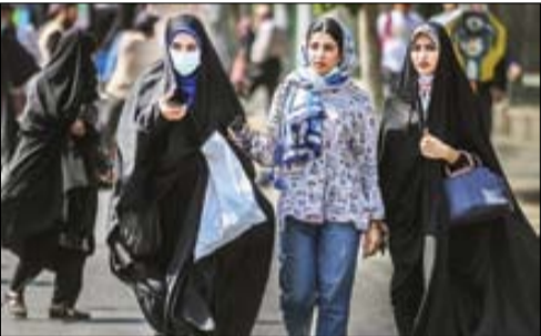
زهره گلپایگانی، رئیس کارگروه ساماندهی مد و لباس کشور: