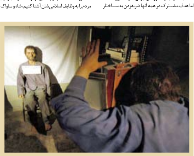
فاطمی از عکاسخانه کمیته مشترک ضد جنایت‌کاران ساواک

حجت‌الاسلام والمسلمین سیدحمیدروحانی (زیرتی)، در خاطره‌ای از امام خمینی به وضوح بر ثبات دیدگاه مبارزاتی ایشان از آغاز نهضت اسلامی تأکید می‌کند. او نقل می‌کند: «پس از حادثه فیضیه، شبی برای نماز به منزل امام رفتم. امام در اتاق کوچکی از منزلشان، نماز جماعت برگزار می‌کردند. پس از نماز، یکی از روحانیان از امام پرسید: اکنون که دولت دستت به خلق عمدتاً مقدمات نظلمی و امنیتی را آماج حملات خود قرار می‌دادند. هرچند الگوی آنان با جنگ‌های چریکی غلظتی است؟ امام در پاسخ فرمودند: اگر ما بتوانیم مردم را به وظایف اسلامی‌شان آشنا کنیم، شاه و ساواک