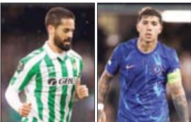
۹۰ دقیقه تا مشخص شدن قهرمان لیگ کنفرانس