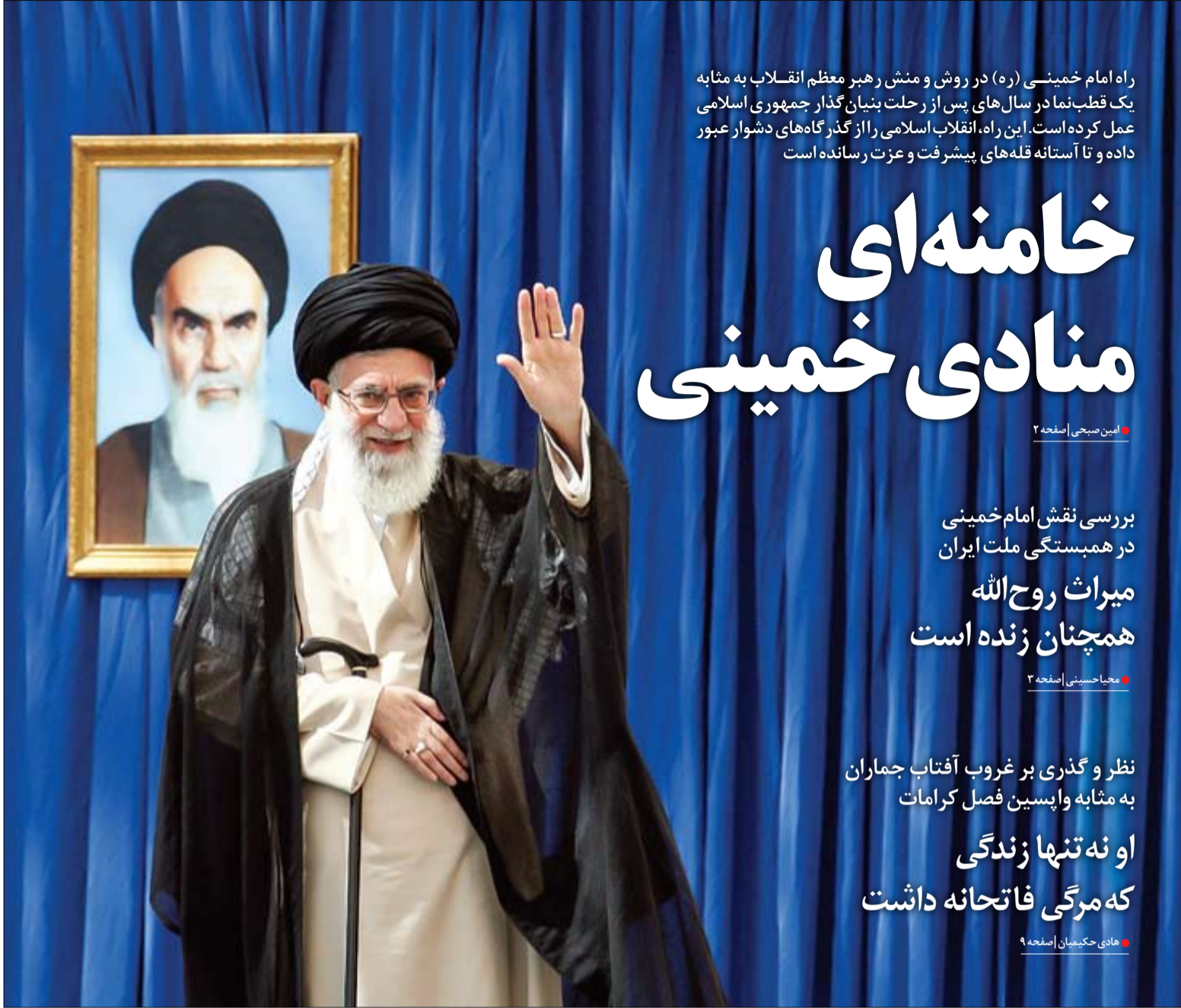
راز ماندگاری انقلاب اگر اعتماد رهبر اول به رهبر دوم و عشق رهبری به امام نیست، پس چیست؟ Leader