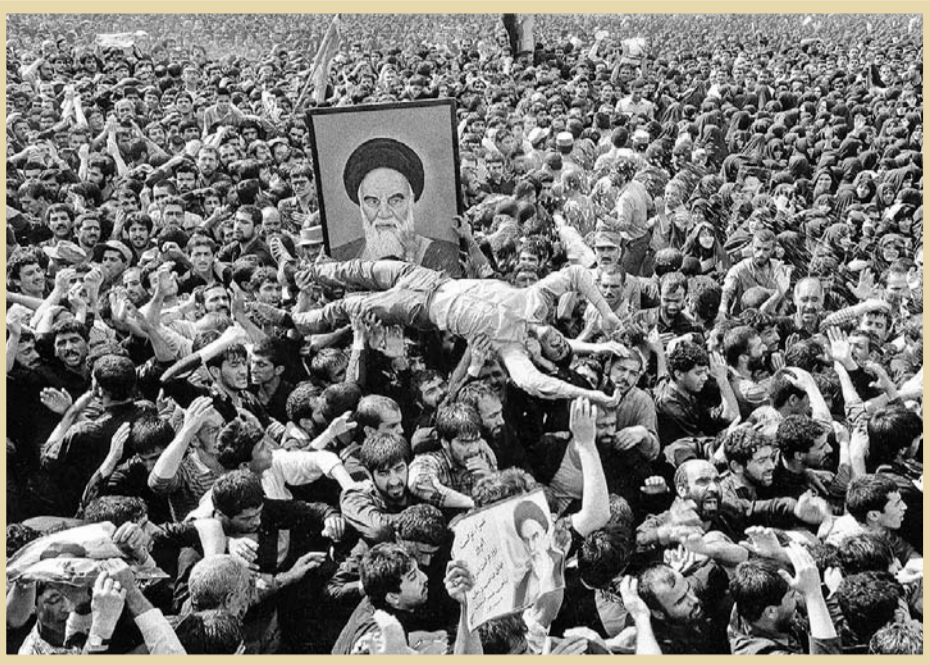
۱۵ خرداد ۱۳۶۸. معنای تهران، مراسم وداع با امام خمینی