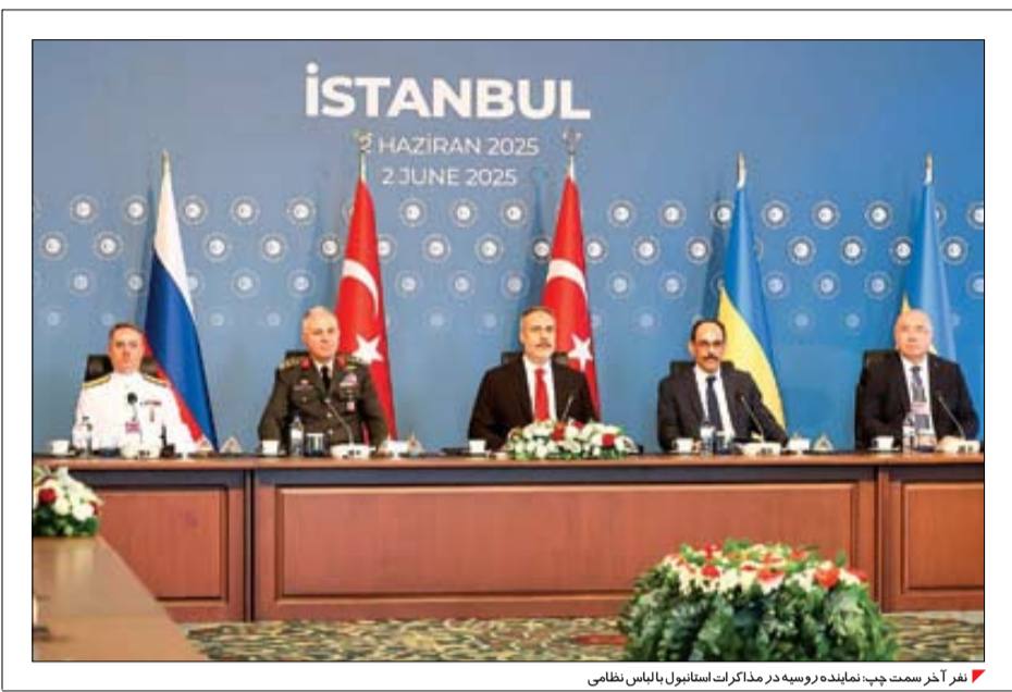
رفقر احمد سخت چپ: نماینده روسیه در مذاکرات استانبول با لباس نظامی

واکنش پوتین به حمله اوکراین: دیگر هیچ خط قرمزی وجود ندارد