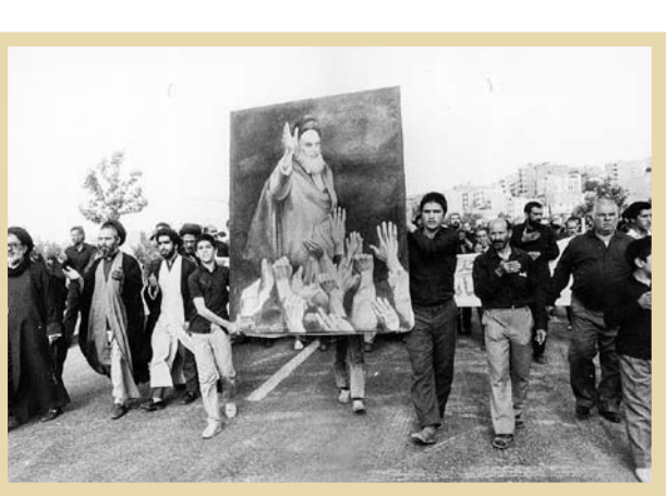
۱۵ خرداد ۱۳۶۸. مراسم تشییع پیکر امام خمینی

امروز در این محفل، چهره‌ها را به هم رساندند. به یاد آن روزهایی که در جست‌وجوی جماران و با مشت‌هایی گره کرده فریاد می‌زدند: روح منی خمینی، بت شکنی خمینی! زمان که همراه مورخان اروپایی و امریکایی، قره‌ن‌هاست نظیر آن در غرب دیده نشده. مردی که در میانه عصر دود آتم، منجی ملت خود شد و با ایمانی سخت به ناکارایی گلوله در برابر شاخه‌های گل، پیروزی خون بر شمشیر را رقم زد. بی‌شک او جلوه‌هایی نابدینی از ملکوت را درک و حتی تجربه کرده بود. او رهبری بود که از فراسوی باورهای مردمش می‌آمد. آیت‌الله در حالی که اقتدار یک رهبر بزرگ را با گونه‌های از مهر و شفقت پدرانہ در هم آمیخته بود، همه قشرها، طبقات و گروه‌ها را به همدلی، هم سخنی و در نهایت همراهی، در پیشبرد اهداف انقلاب فرامی‌خواند. در اوضاعی که عمده نیروهای انقلابی، همکاری و تعامل با مجاهدین خلق را غیر ممکن می‌دانستند، رهبر انقلاب دو نفر از سران گروه مزبور، یعنی مسعود رجوی و موسی خیابانی را به حضور پذیرفت و در دیداری خصوصی در شام اردیبهشت ۱۳۵۸، با ایشان سخن گفت.