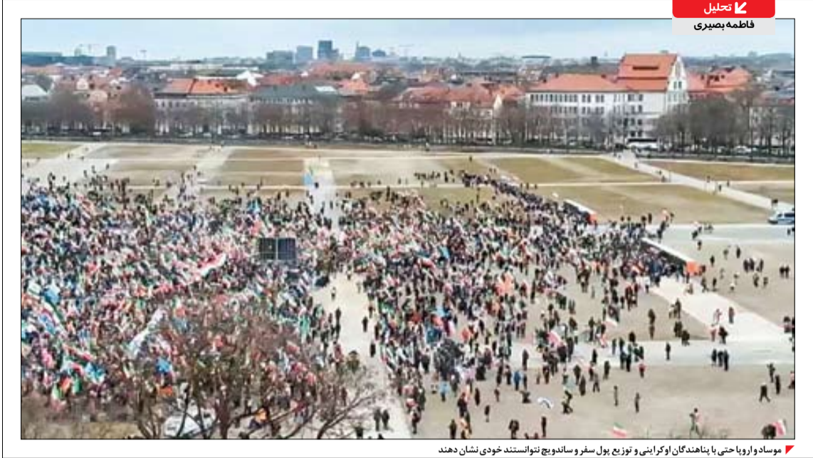
مוסاد و اروپا حتی با پناهندگان اوکرائنی و توزیع پول سفر و سانویج نتوانستند خودی نشان دهند