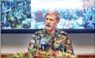
سر لشکر حاتم‌ی: