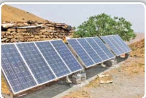
کارآفرینان بسیجی با تولید محصولات متنوع در مسیر اقتصاد مقاومتی گام برمی‌دارند