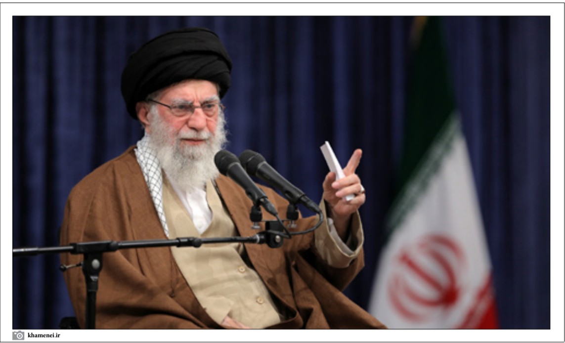
رهبر معظم انقلاب اسلامی صبح دیروز در دیدار هزاران نفر از قشرهای مردم، با «تبیین لایه‌های مختلف حوادث سوریه، ترسیم منطق حضور ایران در این کشور، تشریح روند آتی تحولات منطقه و بیان دیدگاه‌های رهبری در خصوص مسائل امنیتی برای رژیم صهیونیستی به خاک سوریه آن باشد که رژیم صهیونی در حال برداشتن سهم خود از یک جنوب باشد اما در واقعیت مسائل امنیتی برای رژیم صهیونیستی بسیار مهم‌تر از توسعه سرزمینی در آن‌پنده است. آنچه صهیونیست‌ها پس برده نگران آن هستند ورود به مرحله‌ای است که تل آویوا را درگیر جنگ‌هایی بی‌پایان کند و سرمایه درونی‌اش را در مدت کوتاهی به‌طور کامل آب کند. رژیم صهیونیستی در حل حاضر در تلاش است سوریه را بی خطر و دنیوار حالت بزرگی تر ای بسازد تا حداقل سوریه تبدیل به دم مصر دو کند، اما یوم‌نگی که دست جوانان سوری و هسته‌های مقاومت افتاده، پروژه ناامن‌سازی منطقه را دوباره به سوی مناطق اشغالی سرریز خواهد کرد، دست بلند مقاومت روی دست اتاق عملیات فتح‌المبین در آنکارا خواهد زد. اجرای این بازی نیاز به صبر، ظرافت و هوشمندی در شبکه‌سازی دارد.

رهبر معظم انقلاب اسلامی صبح دیروز در دیدار هزاران نفر از قشرهای مردم، با «تبیین لایه‌های مختلف حوادث سوریه، ترسیم منطق حضور ایران در این کشور، تشریح روند آتی تحولات منطقه و بیان دیدگاه‌های رهبری در خصوص مسائل امنیتی برای رژیم صهیونیستی به خاک سوریه آن باشد که رژیم صهیونی در حال برداشتن سهم خود از یک جنوب باشد اما در واقعیت مسائل امنیتی برای رژیم صهیونیستی بسیار مهم‌تر از توسعه سرزمینی در آن‌پنده است. آنچه صهیونیست‌ها پس برده نگران آن هستند ورود به مرحله‌ای است که تل آویوا را درگیر جنگ‌هایی بی‌پایان کند و سرمایه درونی‌اش را در مدت کوتاهی به‌طور کامل آب کند.