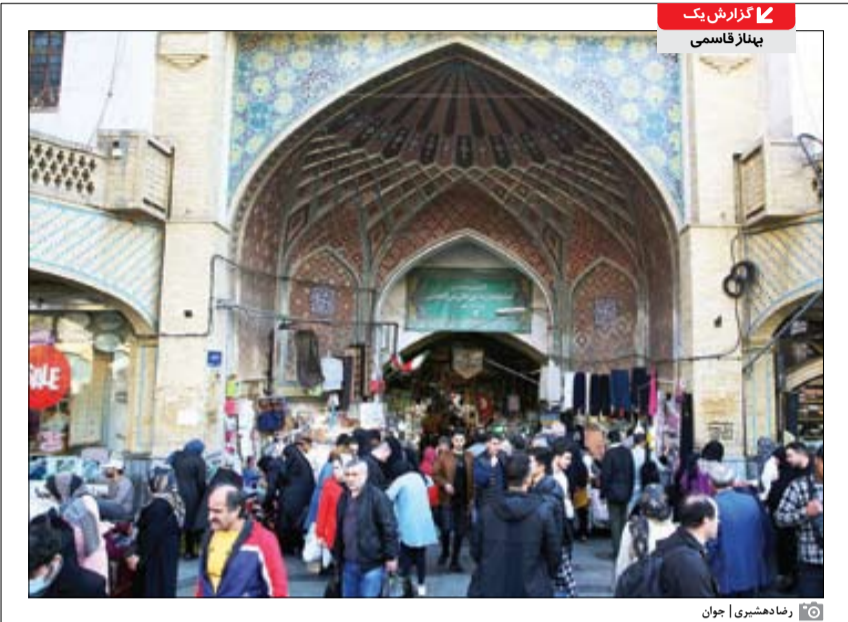
رژمادهمشیری | جوان

توقع دولت از تأمین درآمدها از محل اخذ مالیات ۱۷۰۰هزارمیلیارد تومانی برای سال آینده، برخلاف ادعای وزیر اقتصاد دست کردن در جیب مردم است اما با روش‌های دیگر