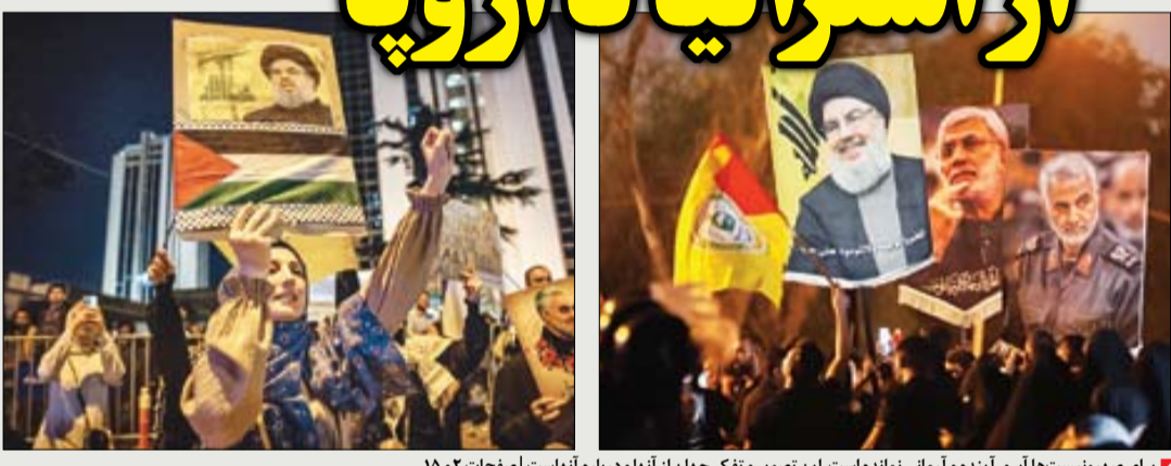
برای صهیونیست‌ها آبرو، آینده و آرمانی نمانده است. این تصویر و تفکر جهان از آنها و درباره آنهاست | صفحات ۲ و ۱۵