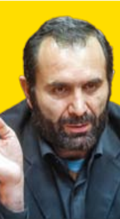
محمدحسین نصرالله، رهبر حزب‌الله لبنان

جنبه عام‌الشمول دارند، بنابراین همه کشورها ملزم به مقابله با اسرائیل هستند، اما متأسفانه نبود اراده سیاسی و نبود ضمانت اجرای کافی و مؤثر باعث می‌شود تا حقوق بین‌الملل نتواند رسالت خود را به انجام برساند. تردیدی نیست که روز به روز ضرورت وجود اصل حقوق بین‌الملل