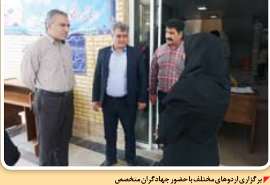
برگزاری اردوهای مختلف با حضور جهادگران متخصص