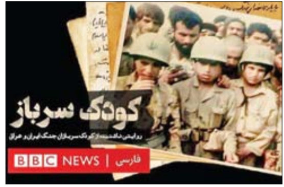
روایتی غمناک از یک کودک سرباز در جریان جنگ ایران و عراق

مستند کودک سرباز که بی بی سی فارسی آن را برای هفته دفاع مقدس تدارک دیده است مغلوب حقیقتی شده که به هیچ عنوان توان قلب آن را نداشته است