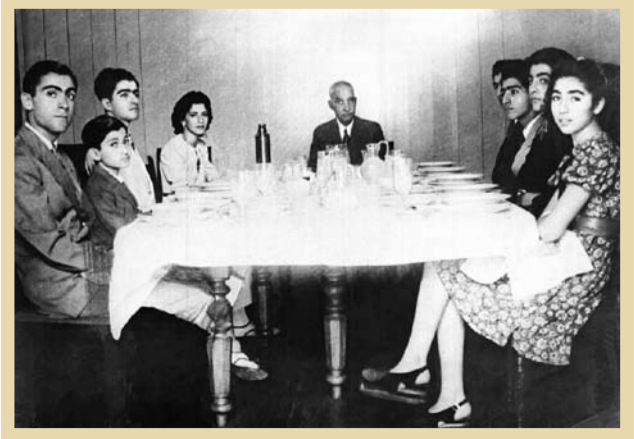
رفیقان رضاخان کنار خانواده عویش در جزیره موریس

همانگونه که اشارت رفت، رضاخان با وعده ورود جمعی و حافظه تاریخی ایرانی‌ها، موضوعی بی‌اهمیت پنداشته شده است. روایت‌ها و تفسیرها در مورد رضاشاه، همواره بسیار ضدونقیض است. رضاشاه در پی اشغال ایران از سوی متفقین به بیان دقیق ۲۵ روز پس از اشغال، وقتی متفقین تهدید کردند وارد تهران می‌شوند، از تهران رهسپار اصفهان شد. از آنجا به کرمان رفت و چند روزی آنجا بیمار بود و بعد