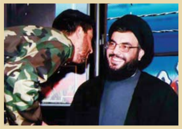
۷۰هـ. شهید سید حسن نصرالله در کنار یکی از رزمندگان حزب‌الله

«جناب سید حسن نصرالله از طریق شهید سیدعباس موسوی - که از برجسته‌ترین فرزندان مکتب شهید آیت‌الله سیدمحمدباقر صدر - به این مکتب پیوست. سیدعباس به محض ورود سیدحسن به حوزه نجف اشرف، او را با آغوش باز پذیرفت، زیرا به نبوغ استثنایی، عشق، استعداد و توانمندی نامتعارف او پی برده بود. بر این اساس سیدعباس موسوی بنا بر توصیه شهید سیدمحمدباقر صدر، مسئولیت تربیت، آموزش و سازندگی فکری و علمی سید حسن نصرالله را بر عهده گرفت. گاهی هر دو به محضر شهید صدر می‌رسیدند و از سیدعباس موسوی نقل شده است که شهید سیدمحمدباقر صدر در یکی از این جلسات به نبوغ فکری سید حسن پی برده بود. می‌توان گفت نخستین بارقه‌های فکری، فرهنگی و علمی سید حسن نصرالله، از راه آشنایی و دوستی با سیدعباس موسوی و حضور در درس شهید فقید سیدمحمدباقر