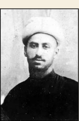
زنده‌یاد میرزا کوچک خان جنگلی در دوران طلبگی

«نهضت جنگل از بزرگ‌ترین و مهم‌ترین نهضت‌های تاریخ معاصر است که بعد از مشروطه تا دوران دیکتاتوری رضاخان در کشور رخ داد. این نهضت از سوی میرزا کوچک جنگلی و عده‌ای از علمای رشت، در آغاز جنگ جهانی اول برای پایان دادن به اشغال ایران رقم خورد. در آغاز جنگ، سرویس جاسوسی چند کشور استعمارگر خصوصاً انگلیس، با تمام قوت مشغول فعالیت مخرب در دنیا بود. پول، رسانه و نیروی نظامی ابزارهایی بودند که جهت تأمین منافع بریتانیادر جنگ اول فعال شدند و هر روز توطئه‌ای طراحی می‌کردند و برای الحاق نقطه جدیدی از دنیا به مستعمرات دیگرشان، نقشه می‌کشیدند. در چنین شرایط بین‌المللی و داخلی، نهضت جنگل حدود هفت‌سال پربا بود و به پیروزی‌های چشمگیری در مقابله با استعمار و بیرون کردن قوای متجاوز روسیه تزاری، انگلیس و عواملشان از گیلان و مناطق همسایه آن رسید و توانست دوبرقدرت روس و انگلیس را، در این منطقه به زانو درآورد. میرزا، با درک موقعیت استثنایی جنگ جهانی اول و ضعف ملت ایران، قائل بود که باید تلاش کنیم، تا خودمان را از زیر بار استعمار و انحطاط نجات دهیم و آنها را از سرزمین‌مان بیرون کنیم. او خطاب به قوای نهضت جنگل در آغازین روزها و در باره انگیزه تأسیس آن،