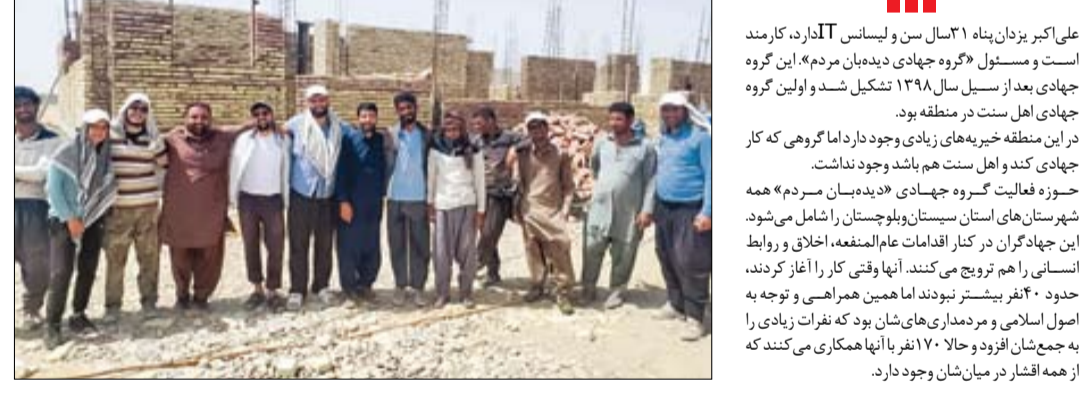
مردم اقدام کرده‌اند که در این مناطق خیریه‌های زیادی وجود دارد اما گروهی که کار جهادگران کند و اهل سنت هم باشد وجود نداشت. حوزه فعالیت گروه جهادی «دیده‌بان مردم» همه شهرستان‌های استان سیستان و بلوچستان را شامل می‌شود. این جهادگران در کنار اقدامات عام‌المنفعه، اخلاق و روابط انسانی را هم ترویج می‌کنند. آنها وقتی کار را آغاز کردند، حدود ۲۰ نفر بیشتر نبودند اما همین هم‌راهی و توجه به اصول اسلامی و مردم‌داری‌های‌شان بود که نفرت زیادی را به جمع‌شان افزود و حالا ۱۷۰ نفر با آنها همکاری می‌کنند که از همه اقشار در میان‌شان وجود دارد.

مردم وقتی می‌بینند عده‌ای بدون آنکه مسئولیتی داشته باشند، به دنبال حل‌وفصل مشکلات و مسائل آنها هستند، روحیه مضاعفی می‌گیرند. جهادگران به صورت تخصصی در همه حوزه‌ها فعال هستند و همین امر نقطه قوت و تبلیغی برای اضافه شدن نفرت دیگر به گروه‌های جهادی است. به گفته مسئول گروه جهادی دیده‌بان مردم، دو بار در این منطقه سیل آمد و در برخی مناطق هیچ گروهی نتوانست کاری انجام دهد، ولی این گروه جهادی خدمات خوبی ارائه کرد که شامل ساختمان سازی، ساخت سرویس بهداشتی، احداث چاه، دیوار کشی و تعمیر سقف خانه‌های آسیب‌دیده بود.