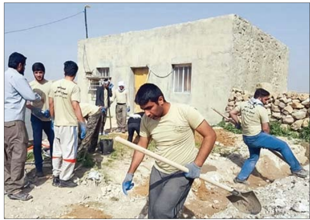
همیشه وقتی قرار می‌شود از گروه‌های جهادی سخن به میان بیاید، از بی‌منت و بی‌سروصدا بودن آنها می‌گوییم. از جهادگرانی که بدون هیچ چشمداشتی کوله‌های خود را برمی‌دارند و به مناطقی می‌روند که جمعی از هموطنان، منتظر و نیازمند کمک هستند، اما این بار می‌خواهیم از مردمی بگوییم که همیشه آغوش باز کرده‌اند تا به جهادگران کمک کنند. در چاهار یک گروه جهادی وجود دارد که وظیفه‌اش آماده کردن مردم برای پشتیبانی و پذیرایی از گروه‌های جهادی است. گروه جهادی «دیده‌بان مردم» در سیستان و بلوچستان نقش آفرینی‌های زیادی کرده و در بسیاری از اتفاقات زودتر از بقیه گروه‌ها خود را برای یاری رساندن به هموطنان به روستاها و مناطق حادثه‌دیده رسانده است. جهادگران این گروه با ذوق و شوق دور هم جمع شده‌اند و گواهی این ادعا همین پس که در عرض چند سال تعدادشان بیش از چهار برابر شده است.

گروه جهادی «دیده‌بان مردم» به اهالی سیستان و بلوچستان آموزش می‌دهد در زمان حضور جهادگران از آنان پشتیبانی و پذیرایی کنند