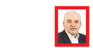
سیدابوالحسن مصطفوی غغام نماینده مجلس

تولیدکننده و صادرکننده محصولات فراورده در بازارهای جهانی تقویت‌کنند که همین رویکرد می‌تواند در بخش معدن نیز اجرایی شود و به جسای صادرات مواد خام معدنی، ایران می‌تواند با ایجاد زیرساخت‌های مناسب و استفاده از فناوری‌های پیشرفته، موادمعدنی را به محصولات نهایی تبدیل کرده و ارزش افزوده بیشتری ایجاد کند. این تنوع‌سازی در تولید و صادرات، اقتصاد ایران را از تکیه بر یک یا چند محصول خاص رها کرده و به سوی اقتصادی پویا و چندوجهی هدایت خواهد کرد. برنامه هفتم توسعه با هدف جذب سرمایه‌گذاری‌های گسترده بخش غیردولتی در حوزه پتروپالایشگاه‌ها، مشوق‌های ویژه‌ای را در نظر گرفته است. از جمله این مشوق‌ها می‌توان به امکان واردات ۳۰۰ هزار بشکه نفت خام روزانه برای تأمین تعهدات و تنفس خوراک در سال اول فعالیت اشاره کرد. در همین راستا مصطفوی خاطر نشان می‌کند: این تسهیلات از یک سو، هزینه‌های اولیه سرمایه‌گذاران را کاهش می‌دهد و از سوی دیگر شرایطی را برای ورود بخش غیردولتی به پروژه‌های بزرگ و استراتژیک فراهم می‌آورد. با این حال، باید توجه داشت که توسعه این پروژه‌ها نیازمند تخصص و توانمندی‌های