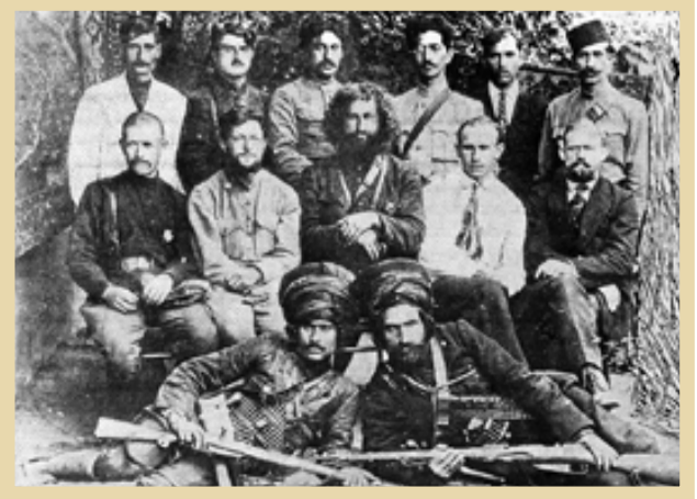
در منزل شهردار بندر انزلی، میرزا کوچک خان جنگلی در حالشبه‌نخستین دور، از مذاکره با هیئت روسی

جنگلی‌ها مانند سندی در برابر زنده‌خواهی‌های اجانب، در شمال کشور عمل کردند. چنانکه فخرایی در این زمینه می‌نویسد: «در وطن پرستی جنگلی‌ها همین بس که هر جا برای مصالح کشور به میان آمد، سرسختی خود را نشان می‌دادند، در مبارزه با قزاقان روس، در نبرد با قزاقان و وثوق‌الدوله، در کمکش با مشایر و ایلات، در بیکار با انگلیسی‌ها و سرخ‌های مصنوعی، ایمان جنگلی‌ها همچنان محفوظ و دست‌نخورده باقی ماند…» بنابراین دفاع از استقلال و تمامیت ارضی ایران از مهم‌ترین اهداف سیاسی جنگ محسوب می‌شد که متأسفانه آنفوذ اعضای حزب کمونیستی به درون نهضت تاخت. دید.میرزا زمانی که متوجه خط انحرافی در نهضت شد، تمام قامت از دو مؤلفه نهضت جنگل، یعنی اسلام و استقلال کشور حمایت کرد. نهضت جنگل به رهبری آن سردار دلیر، هر گونه دخالت اجانب در امور داخلی ایران را مردود می‌دانست و از استقلال و تمامیت ارضی ایران دفاع می‌نمود. در محور نهضت جنگل، دین اسلام و مذهب شیعه به‌عنوان مهم‌ترین رکن استقلال و استقرار او حدت بود. بنابراین مؤلفه‌های اصلی تفکر میرزا کوچک‌خان جنگلی را، می‌توان اینگونه خلاصه کرد: وطن پرستی، تمامیت ارضی، استقلال ایران، منافع ملی و پاسداری از هویت دینی و اسلامی. هر چند میرزا در حوزه سیاسی ناچار شد برای مدتی با حزب «عدالت» و شوروی همکاری کند، اما اختلافات نظری، مذهبی، اقتصادی و اجتماعی بین آنها، همواره همکاری سیاسی‌شان را متزلزل کرد. میرزا هرگز حاضر به سازش با اجانب و استبداد داخلی نشد و تن به ذلت پناهنده‌شدن زیر پرچم کمونیسم را نداد و سرانجام سرفرازانه در خاک میهن به شهادت رسید. او با این برگ پایانی حیات، اسلام‌خواهی و وطن‌خواهی خویش را بر همگان عیان ساخت و البته برای تاریخ به ودیعت نهاد.