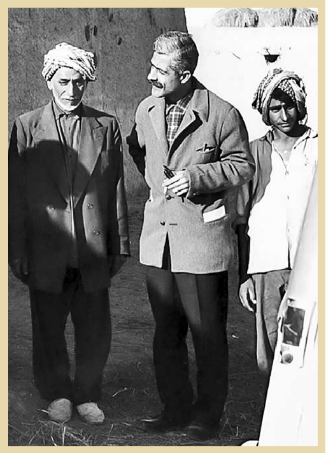
۱۳۴۱. جلال آل احمد در سفر به سرپل دهب

تبدیل بل به یک صنف شده و به همین دلیل شجاعت و چالاکي خود را از دست داده و در دایره بسته افکاری که رسانه‌های قدرتمند غرب به شکلی مستمر القا می‌کنند، گاهی افضاتی می‌کند و عده‌ای را می‌شوراند و تمام!