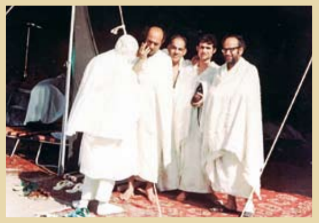
«هفته ۴۰ دکتر علی شریعتی در سفر حج»

به کارگیری فهم خویش، همواره در طول تاریخ کار دشواری بوده است و از آن دشوارتر، بیان شجاعانه افکار، آن هم در زمانه‌ای که دیگران بر خوردار از فناوری‌های متعدد، در تولید محصولات گوناگون از جمله فرآورده‌های فکری، شبانه‌روز دست‌اندر کار تولید اندیشه و نظریه هستند و زحمت را از دوش جریان روشنفکری برداشته‌اند! ا وقتی رسانه‌ای هست که اسباب فهم را فراهم کند و کتابی هست که ریز و درشت راه را نشان دهد، چه نیازی است به جان‌کندن روح و عرق‌ریزان مغز؟ اگر بولی هم فراهم باشد که بتوان معاش را با آن تأمین کرد، چه نیاز به اندیشیدن؟ دیگران این کار دشوار را انجام می‌دهند و ما بهره‌می‌بریم! دغدغه فکری، آفت آسوده خیالی است. چه کاری است تن به