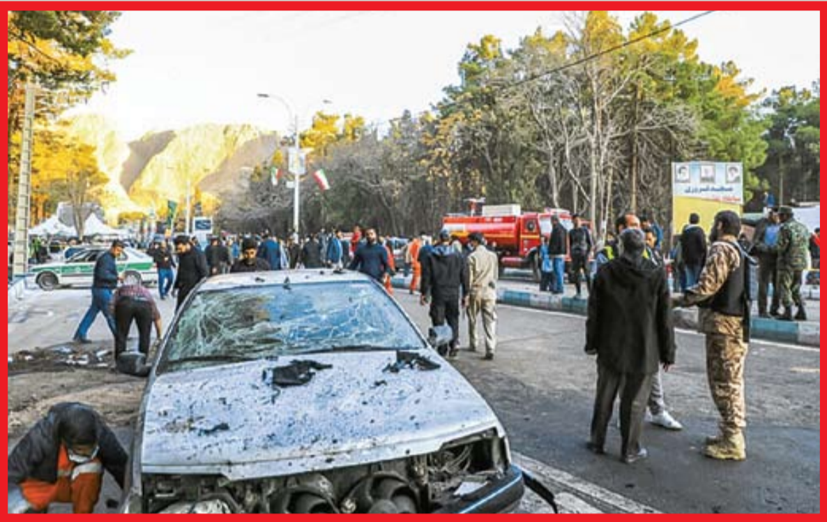
محلای از حادثه تروریستی گلزار شهدای کرمان