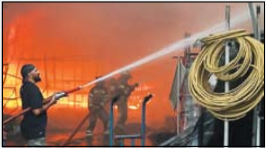
آتش‌سوزی بزرگ در بازار یارسیان در ضلع غربی بازار آهن شادآباد تهران