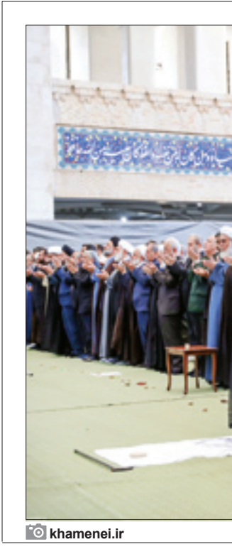
محسن رادای در مراسم عزاداری در تهران

به‌بخش بین‌المللی این نماز جمعه پیرزایم، شاهد بودیم اصلا خطبه دوم نماز جمعه به عربی ایراد شد و واکنش‌های زیادی هم در جهان عرب داشت، دلیل تأثیر این اقدام را در جامعه عربی چه می‌دانید و به نظر شما این چنین اقداماتی چقدر ضرورت دارد؟ از نظر بین‌المللی این موضوع مهم بود که رهبر انقلاب برای ارتباط برقرار کرن با سایر مسلمانان و عرب‌زبانانی که در محور مقاومت قرار دارند، خطبه دوم خود را به عربی بیان کردند. این را باید پذیریم که اگر محور مقاومت، جمهوری اسلامی و حتی ایران بخواهد ادامه پیدا کند ایران دچار تجزیه و شکست نشود، چاره‌ای نداریم جز اینکه ببیندهای خود را با کشورهای اسلامی و همسایگی گسترش بدهیم، اگر نتوانیم با مردم منطقه و مردم همفکر خودمان در خارج از مرزهایمان ارتباط برقرار کنیم، شک نکنید که ضرورت مرزی و ایران به خطر می‌افتد.