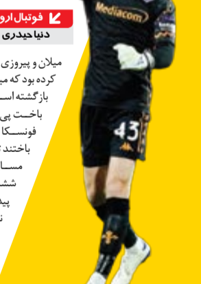
فوتبال اروپا دنیا جدیدی

ناکامی گویی قرار نیست دست از سر میلان بردارد. برتری در دربی میلان و پیروزی پرگل مقابل لچه این تصور را ایجاد کرده بود که میلان بار دیگر به روزهای اوج خود بازگشته است اما این رؤیا خیلی زود بعد از دو باخت بی‌دری رنگ باخت؛ چراکه باران فونسسکا بعد از بایرلورکوزن، به فیوتینا هم باختند تا با کسب ۱۱ امتیاز از سه برد، دو مساوی و دو باخت، به جایگاهی بهتر از ششمی جدول رده‌بندی سری آ دست پیدا نکنند! آن هم با تفاضل گل بهتر نسبت به تورینو؛ مصاف فیورنتینا- میلان بی‌شک