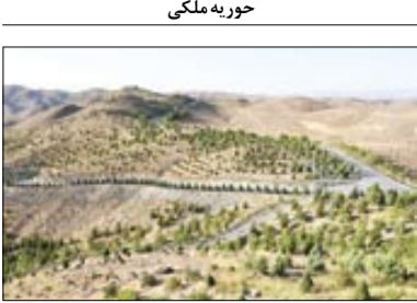
حور به ملکی