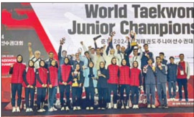
شوناوروزی | خبرنگار گروه ورزشی

۹۶ کشور حاضر در چهاردهمین دوره مسابقات تکواندو قهرمانی نوجوانان جهان، بهترین نفرات خود را در این رده سنی راهی چانچئون کرده بودند، اما دختران و پسران ما یک سر و گردن از همه رقبا بالاتر بودند و خوشترنگ‌ترین و بیشترین مدال‌ها را به گردن آویختند. حاصل تلاش هست دختر ملی‌پوش ما کسب پنج مدال طلا و یک نقره بود. تیم پسران نیز موفق به کسب سه طلا، یک نقره و