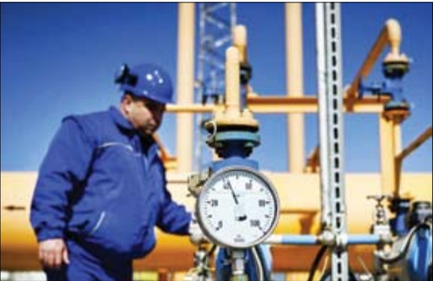
کارشناس انرژی در حال بررسی تجهیزات صنعتی در یک کارخانه تولید گاز.