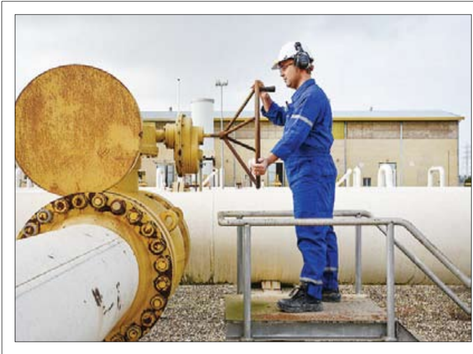
کارشناس انرژی در حال بررسی تجهیزات صنعتی در یک کارخانه تولید گاز.

برنامه هفتم توسعه بر حل ناترازی گاز با محور اصلی ذخیره‌سازی تمرکز کرده است و باید عملیاتی شود