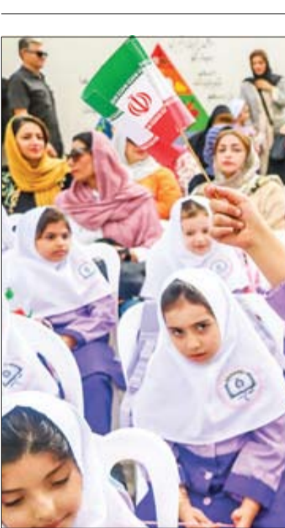
بزبان صمدی ادیر

شہوت بازسازی اعتبار موساد، باعث شده که اسرائیلی‌ها با انجام عملیات ۱۷ سپتامبر که دیروز نیز به شکل و شمایلی جدیدتر ادامه پیدا کرد، چشم به روی نتایج معکوس آن ببندند. اسرائیل با حملات سایبری در تلاش است تا ارتباط بین غزه و لبنان را که نصرالله همچنان بر آن اصرار دارد، قطع کندولی ابراز تردید می‌کنند که این حملات به چنین نتیجه‌ای منجر شود و حزب‌الله را برای رسیدن به توافق برانگیزد که نیز واهیش را از مرز دور کرده و اجازه بازگشت ساکنان شمال اراضی اشغالی را بدهد | صفحه ۱۵