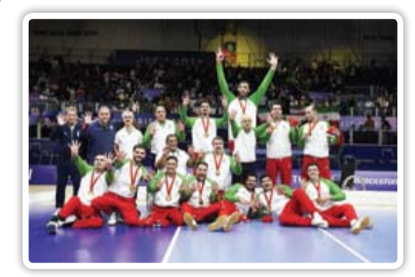
از قهرمان همیشه تا درخشش وزنه‌برداری و تیر و کمان