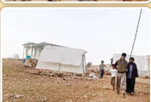
خدمات رسانی فرارگاه جهادی شهید احمد متوسلیان در اندیکای خوزستان