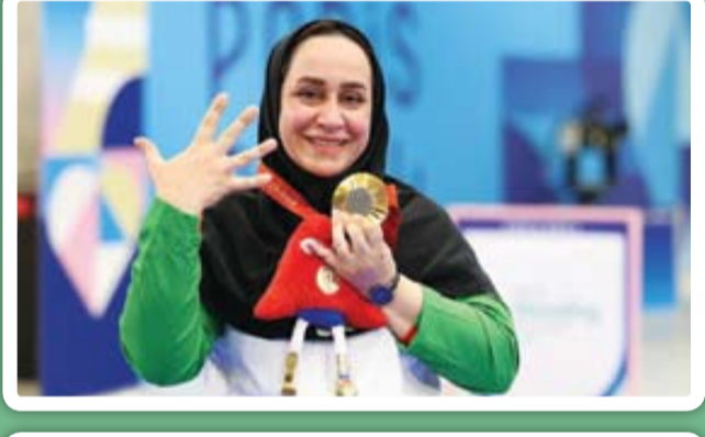
از قهرمان همیشه تا درخشش وزنه‌برداری و تیر و کمان