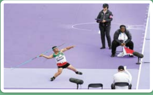
پاریس بسته شود.