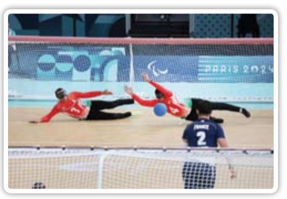
رشته‌هایی که در پاریس دست‌شان به مدال نرسید

فریدون حسن هفدهمین دوره بازی‌های پارالمپیک در حالی به پایان رسید که مطابق تصور، ورزشکاران جانباز و توان‌یاب کشورمان با مدال آوری‌های خاص خود برای ایران سربلند افتخار آفرینی کردند. پارالمپیک پاریس هم نقطه عطف در ورزش ایران بود؛ کاروان «فرزندان ایران» با کسب ۲۵ مدال خوش‌رنگ رکوردشکنی کرد و بیشترین مدال تاریخ این مسابقات را برای ورزش کشور به ارمغان آورد. هر چند ایران با یک پله نزول در جدول نسبت به پارالمپیک توکیو چهاردهم شد و در کسب مدال طلا کمی عقب ماندیم اما تمام این مسائل نمی‌تواند ذراتی از شایستگی‌های پرورده‌های این کاروان دوست‌داشتنی کم کند. باید توجه داشته باشیم که ورزشکاران جانباز و توان‌یاب ایران در چه شرایطی خود را آماده و پاراوی با حرفان جهانی می‌کنند. نوع نگاه ورزش ایران به این عزیزان افتخار آفرین هنوز نگاه قهرمانانه نیست و این ورزشکاران حتی بعد از افتخار آفرینی‌ها زیاد با بی‌مهری‌ها و کم‌توجهی‌های زیادی روبه‌رو می‌شوند. نکته قابل توجه در خصوص ورزشکاران جانباز و توان‌یاب اینکه ورزش برای آنها امری لازم و واجب است. آنها با نمایش قدرت خود در میدان‌های ورزشی به همه ثابت می‌کنند که با وجود داشتن محدودیت و معلولیت جسمی به لحاظ روحی و روانی در چه سطح بالایی قرار دارند و می‌توانند حتی از ورزشکاران سالم هم پیشی بگیرند. ورزش ایران شاهد این بوده که ورزشکارانی از این دست حتی به رقابت‌های المپیک راه پیدا کرده (زهرآ نعمتی) و در آنجا رقبای بزرگ جهانی خود را به چالش کشیده است. همین مسئله تأییدی بر این موضوع است که باید به این ورزشکاران توجه بیشتری شود. مسئله دوم در خصوص ورزشکاران جانباز و توان‌یاب تلاطم مدال آوری و کسب موفقیت‌های