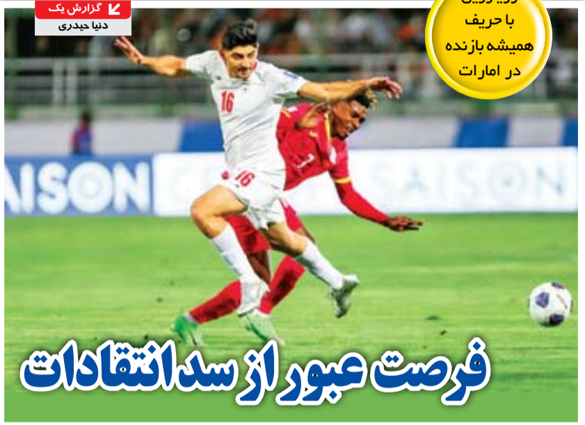
گزارش یک دنیا حیدری