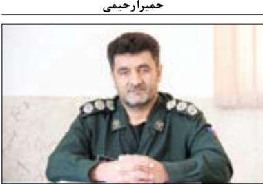
مسئول بسیج سازندگی سپاه قمرینی هاشم (ع) در گفت‌وگو با « جوان» عنوان کرد