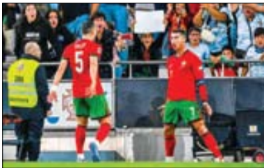
تقابل حساس هلند - آلمان در لیگ ملت‌ها