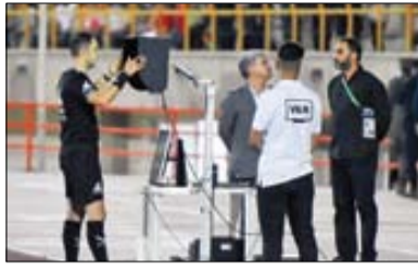
هفته پر حاشیه تمام شد