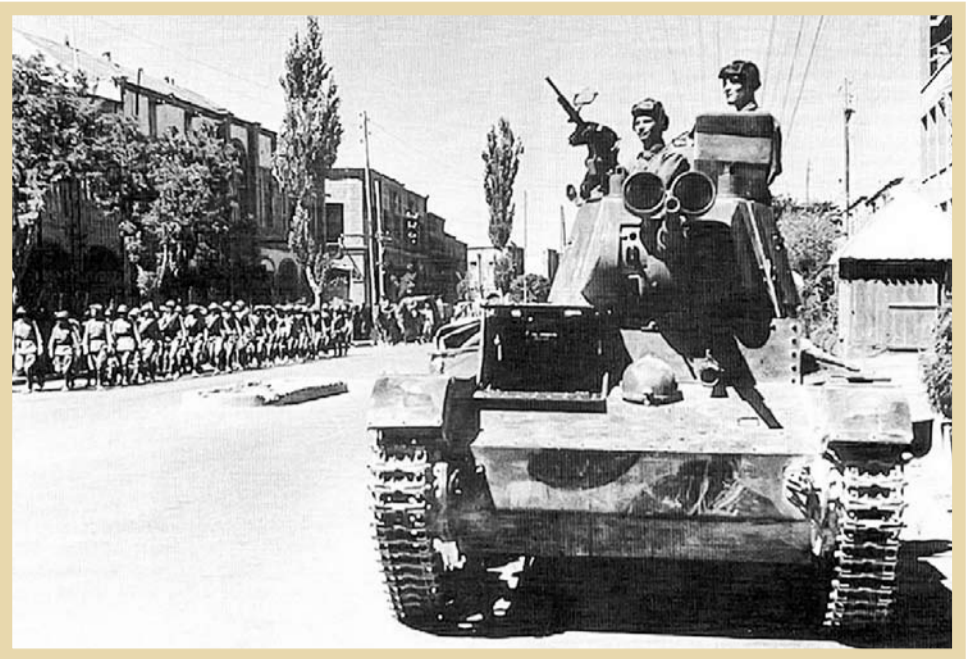
تصویری از حمله متفقین به ایران در شهریور ۱۳۲۰

در اواخر دوره جنگ‌های ایران و روس، قائم‌مقام و عباس میرزا در یافتند، در بار قصد ندارد به آنها کمک کند، لذا دست به دامان علما شدند و از آنها خواستند که فتوای جهاد صادر کنند. به دنبال این تقاضا فتاوی جهادیه صادر شدند. طبق این فتاوا بر هر مسلمانی واجب بود با کفار روس بجنگد و چنانچه در این جنگ کشته می‌شد، به مقام شهادت می‌رسید. نتیجه این شد که تنها در آذربایجان ۱۰۰هزار نفر برای مبارزه با روس‌ها بسیج شدند و توانستند همه مناطق از دست رفته را پس بگیرند، اما متأسفانه باز هم عناصر نفوذی این ظرفیت‌ها را از بین بردند و جریان ماسونی و جریان غربگرا مانع از دخالت روحانیت شیعه در امور شدند