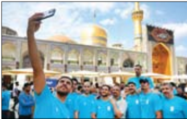
کاروان پارالمیک از مشهد بدرقه شد