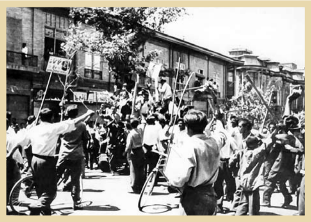
تهران،تظاهراتی اوقایع کودتای ۲۸ مرداد ۱۳۳۲