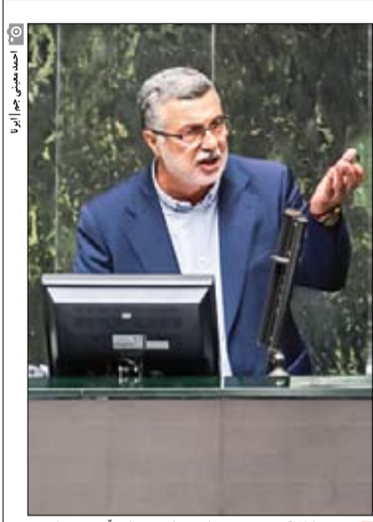
محمد رضا ظفر قندی، وزیر پیشنهادی بهداشت، درمان و آموزش پزشکی