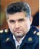
سرهنگ فیروز کشیر