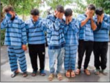
عکس، بارشادهشیری | جوان