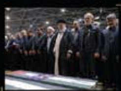
اقامه نماز رهبر انقلاب بر پیکر مجاهد بزرگ شهید اسماعیل هنیه ۱۴۰۳/۰۵/۱۱