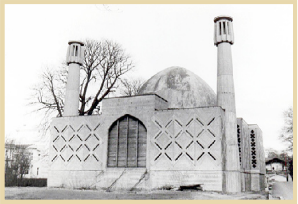
دهه ۴۰ نمای از مسجد امام علی (ع) مرکز اسلامی هامبورگ آلمان

آیت‌الله بهشتی در گفت‌وگو با جوانان ، سعه‌صدر را ملاک قرار می‌داد و با درک واقعیات موجود با افراد و تشکل‌های مختلف رفتار می‌کرد . روشی که تا حدود فراوان، متفاوت از شیوه‌های دیگر روحانیون بود . هم از این روی نیز آوازه علمی – مذهبی وی، فراتر از مرزهای آلمان رفته بود . به عنوان مثال ایشنان در فروردین ۱۳۴۴ در سمنینار انجمن‌های اسلامی کشورهای آلمان غربی، اتریش، انگلستان و فرانسه – که به مدت سه روز در شهر ایستن‌هود، واقع در آلمان غربی برگزار شد – شرکت و سخنرانی کرد