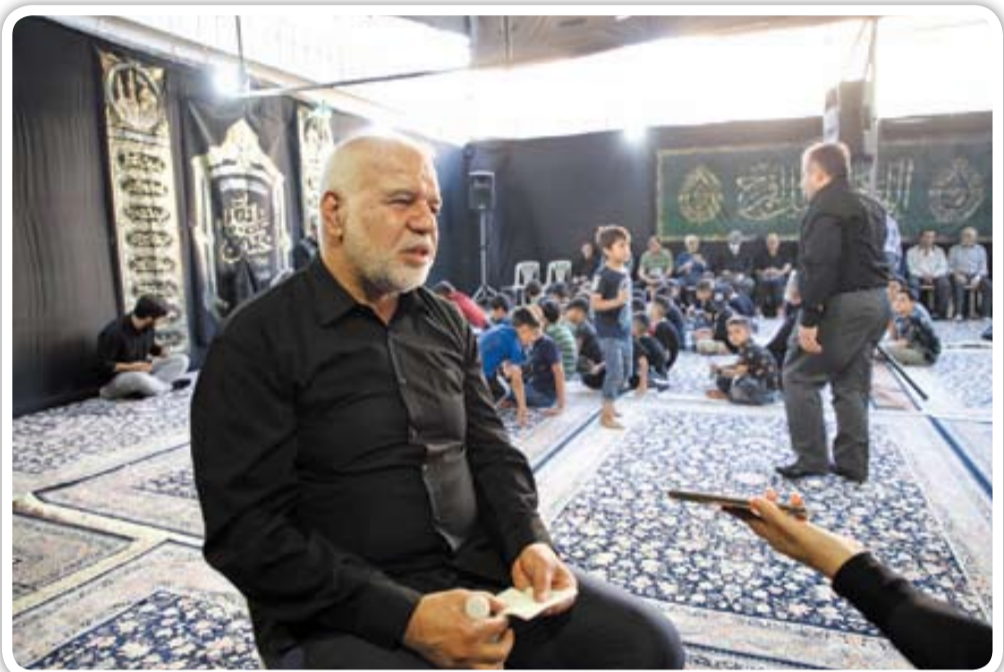
هیئت دو طفلان مسلم، محله هاشمی تهران | ۵ مهر ماه ۱۳۹۸

و تشویق برای حضور در محفلی است که هم دنیا دارد و هم آخرت و رویکرد مهم دیگر مصاحبه مسئله بسیار مهم یعنی «خانواده» است به همین دلیل پذیرفت این مصاحبه زیر خیمه امام حسین(ع) انجام شود. هیئت «دو طفلان مسلم» ۲۷ سال است با مدیریت وی و دیگر پیر غلامان در محله هاشمی در غرب تهران فعالیت دارد و مجریان او جوانانی از همان محله هستند. ساعت مصاحبه یک ساعت قبل از شروع عزاداری هماهنگ شد. وقتی وارد کوچه هیئت شدم، صف طولانی از بانوان شکل گرفته بود که منتظر بودند در هیئت باز شوند تا داخل حسینیه‌ای که در یک مدرسه برپا شده است بروند، اما قسمت برادران چند خانه آن طرف‌تر باز بود و تعدادی از عزاداران هم داخل حسینیه نشسته بودند. نکته‌ای که خیلی چشمگیر بود تعداد زیاد کودکانی بود که به جرئت می‌توانم بگویم تعدادشان چند برابر مردانی بود که در هیئت حضور داشتند. این نشان می‌داد این هیئت ضرورت جذب کودکان و نوجوانان را خوب رعایت کرده که یک ساعت قبل از شروع