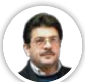
کامران شرفشاهی، شاعر و مؤلف ادبیات عاشق‌ورایی: