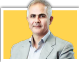
نماینده مجلس در گفت‌وگو با «جوان»: