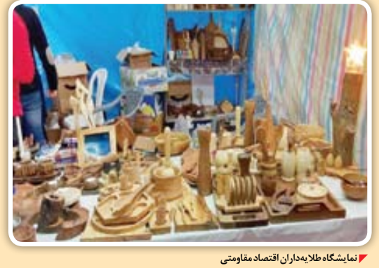
نمایشگاه طلا به داران اقتصاد مقاومتی