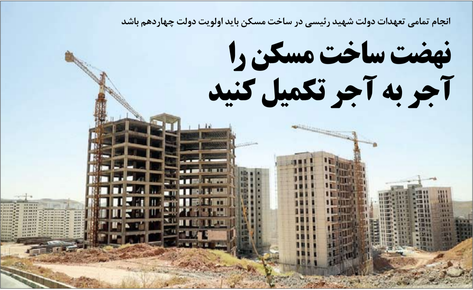
رماهشیری | جوان

مسکن از سوی دولت نظیر عرضه زمین و همچنین فراهم کردن زیر ساخت پرداخت تسهیلات ساخت مسکن به مردم صورت گرفته است و حالا پس از اتمام دولت سیزدهم با شهادت رئیس دولت سیزدهم، باید همه این تعهدات قانونی در دولت چهاردهم ایران نیز پاسخ داده شود و هیچ دولتی نمی‌تواند نسبت به ساخت مسکن بی‌تفاوت باشد و باید تعهدات ساخت مسکن برای بیش از ۲/۱۵ میلیون نفر سرپرست خانواده در دولت