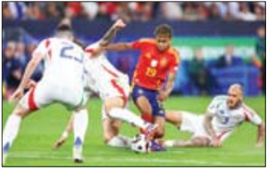
خط و نشان اسپانیا برای قهرمانی