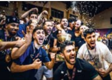
بسکتبال شیوا نوروزی

رالی نفسگیر و طولانی فینال لیگ برتر بسکتبال با قهرمانی تیم طبیعت به پایان رسید. شهرداری گرگان و طبیعت دیدار پنجم فینال بیست و پنجمین دوره این رقابت‌ها را در حالی برگزار کردند که سالن امام خمینی (ره) گرگان از چند ساعت قبل از شروع بازی پر شده بود. حساسیت مسابقه، حضور بیش از گنجایش هواداران و حواشی قبلی احتمال بروز جنجال جدید را افزایش داده بود. این پیش‌بینی در آخرین ثانیه‌های وقت اضافه به حقیقت پیوست؛ بعد از ثبت نتیجه ۹۹ بر ۹۴، هم‌بازیکنان میزبان هم هوادارانشان می‌دانستند در ۱۷ ثانیه باقیمانده جریان نتیجه امکانپذیر نیست. برتاب بطری، اشیا و