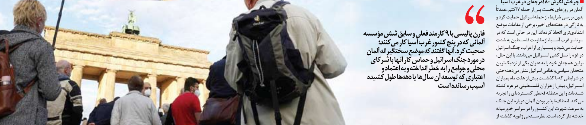
فارن پالیسی با ۹ کارمند فعلی و سابق شش مؤسسه آلمانی که در پنج کشور غرب آسیا کار می‌کنند؛ صحبت کرد. آنها گفتند که موضع سختگیرانه آلمان در مورد جنگ اسرائیل و حماس کار آنها با شرکای محلی و جوامع را به خطر انداخته و به اعتماد و اعتباری که توسعه آن سال‌ها با دهه‌ها طول کشیده آسیب رسانده است

سختگیرانه آلمان در مورد جنگ اسرائیل و حماس کار آنها با شرکای محلی و جوامع را به خطر انداخته و به اعتماد و اعتباری که توسعه آن سال‌ها با دهه‌ها طول کشیده است آسیب رسانده است. همه به شرط ناشناس ماندن صحبت کردند تا شغل خود را از دست ندهند. این منابع به فارن پالیسی گفتند که آنها مدت‌هاست که در خلوت به آنچه که نمی‌توان به طور علنی در آلمان بیان کرد اعتراف کرده‌اند از جمله اینکه راه‌حل دو کشور، راهکاری مرده است، اشغال کرانه‌باختری به دست اسرائیل معادل آپارتاید است و سیاست خارجی آلمان از واقعیت‌های موجود در حین درگیری فلسطینیان و اسرائیل دور است. بسیاری از سازمان‌های آلمانی که در غرب آسیا کار می‌کنند، برای محافظت از کارکنان و شرکای محلی شان، بی‌صدا رویدادهای عمومی را لغو کرده، انتشار گزارش‌ها را به تعویق انداخته‌اند یا نشان‌های خود را از پرونده‌هایی که حمایت می‌کنند حذف کرده‌اند. چندین منبع هم گفتند که آنها نگرانند که رسانه‌ها یا دولت آلمان ممکن است سازمان‌های آنها یا شرکای محلی آنها را به یهودی‌ستیزی متهم کند. روالری کیسی / افان پالیسی