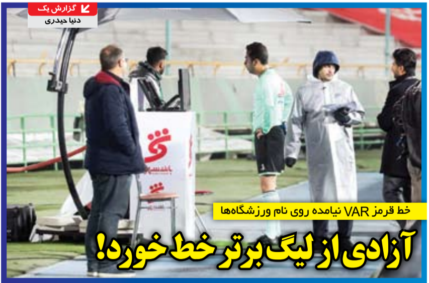
خط قرمز VAR نیامده روی نام ورزشگاه‌ها

در شرایطی که آقایان مسئول در فدراسیون فوتبال و سازمان لیگ از عدم مهیا شدن ورزشگاه آزادی در هفته‌های نخست لیگ بیست و چهارم خبر می‌دهند، وزیر ورزش تأکید دارد آقایان باید برنامه‌های بازسازی آزادی را سریع پیش ببرند: «با توجه به ۱۲۰۰ میلیارد تومانی که دولت برای این موضوع تخصیص داده است باید در اسرع وقت کارها انجام شود. در این بین