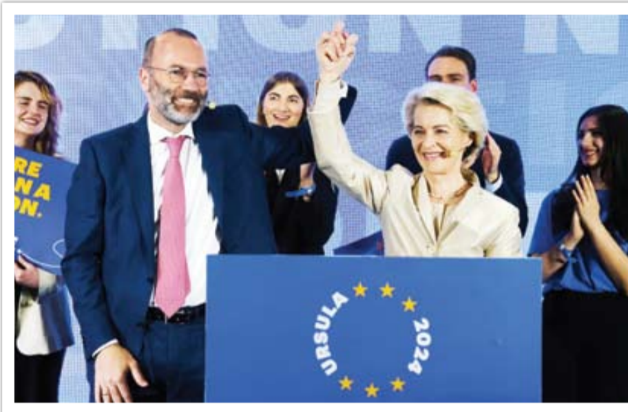
توازن قدرت در پارلمان اروپا به سمت راست متمایل شده است

در فرانسه، حزب راست‌گرای افراطی «اجتماع ملی» به رهبری مارین لوپن توانسته حدود ۳۲ درصد از آرا را به دست آورد. این میزان حمایت حدود ۱۰ درصد بیشتر از انتخابات سال ۲۰۱۹ و ۱۷ درصد بیشتر از رأی‌های حزب رنسانس امانوئل ماکرون رئیس‌جمهور فرانسه است. در آلمان نیز حزب راست افراطی «آلترناتیو برای آلمان» (AFD) با کسب ۵/۱۶ درصد از آرا، به دومین حزب پر قدرت این کشور تبدیل شده است. در هلند، حزب چپ سبز و حزب کارگران هشت کرسی از ۳۱ کرسی این کشور در پارلمان اروپا را به دست آورده‌اند و پشت سر آنها حزب راست افراطی «آردی هلند» (PVV) متعلق به خیریت ویلدرز قرار دارد که هفت کرسی به دست آورده است. این در حالی است که ویلدرز در آخرین انتخابات اروپا به پارلمان راه نیاافته بود. در ایزن، حزب پوپولیست برداران ایتالیا (FDI) با کسب ۲۷ کرسی، بیشترین افزایش را داشت. این افزایش در حالی است که آرای حزب راست‌گرای افراطی لیگای در ایتالیا با کسب فقط هشت کرسی کاهش چشمگیری داشت؛ اما این کاهش کرسی‌های احزاب راست‌گرا در فرانسه، آلمان، هلند و لهستان جبران شد. در