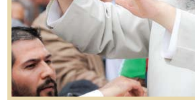
اردیبهشت ۱۴۰۳ شهید آیت‌الله رئیسی در سفر به شهر ستاری

صاحبان تربیون‌های گوناگون، از سماحت و سعه صدر رئیس‌ فقید دولت، خاطراتی شنیدنی به دست داده‌اند. آنان گاه نسبت به برخی شرایط اجتماعی و اقتصادی انتقاداتی را مطرح کرده‌اند، اما در پی آن توقع چنین استقبالی از سوی