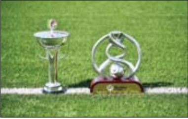
خطری که از بیخ گوش استقلال و پرسپولیس گذشت