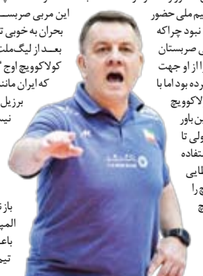
فدراسیون والیبالیست‌ها ایران با اخراج پانز، فرصت را از دست داد. پانز با هفت شکست از تیم ملی ایران اخراج شد تا حتی لیگ ملت‌ها راهم تمام نکند؛ مدتی که فرصت داشت و نه بازیکن؛ مربی‌ای که شاید اگر اندکی زمان داشت می‌توانست نتایج متفاوت کسب کند اما نه در انتخابش مقوله زمان محاسبه شده بود و نه وقت اخراجش!