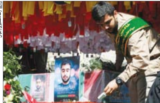
رسانه‌شناسی | جوان

محمدجواد اخوان: به رغم آنکه شعار شهید رئیسی، آزادی مطبوعات و منتقدان نبود، برخلاف دولت آقای روحانی که با شعار «پناه به خدا از بستن دهان منتقدان» در انتخابات رأی کسب کرد، در عمل پذیرش انتقاد را اثبات کرد. به اذعان چهره‌ها و رسانه‌های اصلاح‌طلب، رئیس‌جمهور پیشین نسبت به روزنامه‌ها و