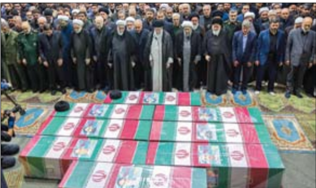
سه بار تکرار «اللهم اننا لانعلم منعم الا خیرا» در نماز شهدای خدمت، زبان حال مردم بود

محبت عاشقانه و خدمت صادقانه تلازم دارند. وقتی خدمت صادقانه داشته باشی، محبت عاشقانه می بینی. بر عکس آن هم درست است، یعنی اگر خدمت کنی، محبت می بینی. اما کسی مانند سید ابراهیم، به امید محبت مردم کار نکرد، نه اینکه محبت و رضای خدا را در محبت و رضای مردم نداند و جست و جو نکند، چرا همین گونه بود و محبت خدا را در میان مردم و در محبت آنان می جست اما این گونه نبود که اگر رنجشی و زخوریانی یا قدر ناشناسی و دشنامی از گروهی یا دسته ای ببینی، از دامنه خدمت و سختی کشیدن دست بردارد یا خدمات او از نامهربانی یک اقلیت مطلق، سست شود. مردم این صدق و خلوص و تلاش و خستگی نا پذیری را درک کردند و اینچنین شد که دوم خرداد ۱۴۰۳ با یک حماسه تاریخی قدردانی در حافظه ملت ایران به ثبت رسید بقیه در صفحه ۲