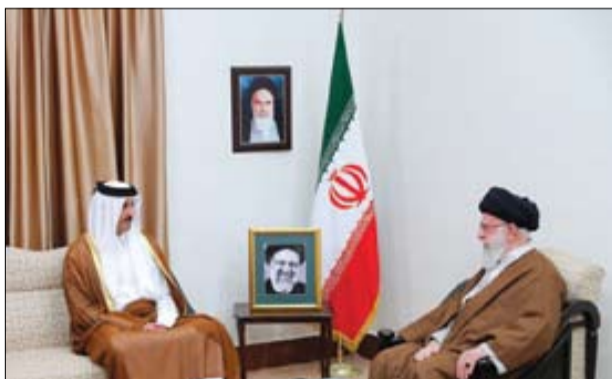
■ «تمیم بن حمد بن خلیفه آل ثانی» امیر قطر که جهت ادای احترام به رئیس جمهور شهید ایران به تهران آمده بود با رهبر انقلاب دیدار کرد