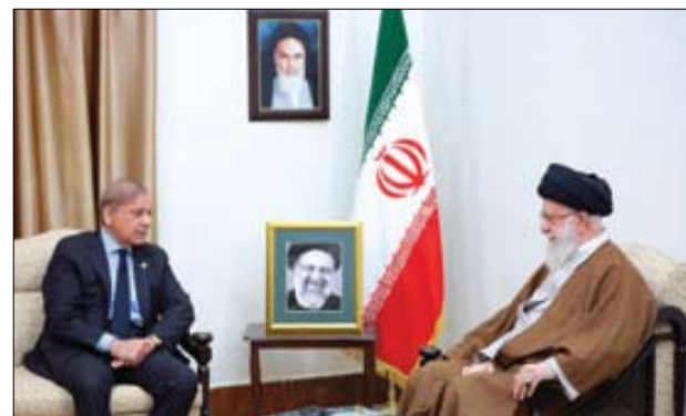
■ رهبر معظم انقلاب در دیدار شهباز شریف، نخست وزیر پاکستان؛ سفر اخیر آقای رئیسی به پاکستان می تواند نقطه عطفی در روابط دو کشور باشد و آقای دکتر مخبر مسیر همکاریها و توافقها را پیگیری خواهند کرد