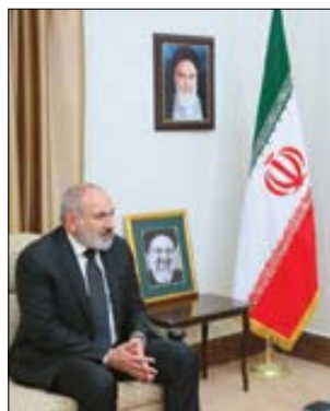
■ نخست وزیر ارمنستان: مطمئنیم که تحت هدایتها و رهبری شما خللی در امور ایران به وجود نخواهد آمد