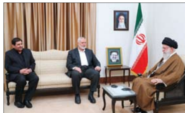
■ رهبر معظم انقلاب در دیدار اسما عییل هنیه، رئیس دفتر سیاسی حماس؛ به لطف الهی آن روزی که فلسطین از «بحر» تا «نهر» تشکیل شود، فرا خواهد رسید