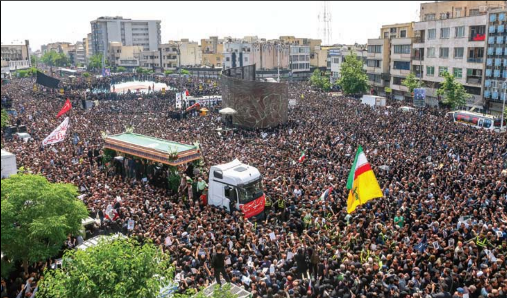
با این جمعیت ها نا آشنا نیستیم اما تکرار آن هر بار پس از کوهی از ادعای خلاف آن، معانی و مفاهیم را برای ما عوض می کند.

■ نروژ، ایرلند و اسپانیا روز چهارشنبه اعلام کردند که از روز ۲۸ مه ۲۰۲۴ (۸ خرداد ۱۴۰۳) فلسطین را به عنوان یک دولت به رسمیت می شناسند تا اولین تبعات دیپلماتیک هشت ماه جنگ اسرائیل علیه غزه و نتیجه عملیات ۷۲ روزه حماس روشن شود. در حالی که گفته می شود کشورهای اروپایی بیشتری برای به رسمیت شناختن کشور فلسطینی آماده هستند، اسپانیایی ها در حمایت از تصمیم دولت شان، به خیابان ها آمدند و جشن گرفتند | صفحه ۱۵