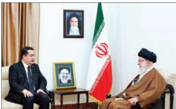
■ محمد شیاع السودانی نخست وزیر عراق، تشییع باشکوه رئیس جمهور شهید ایران، نتیجه خدمت به مردم است و این درس باید سرلوحه ما در عراق نیز باشد

سران سیاسی برخی از ۶۰ کشوری که برای شرکت در مراسم ادای احترام به رئیس جمهور فقید به ایران سفر کردند، با رهبر معظم انقلاب دیدار و تسلیت ملت و دولت های خود را اعلام کردند صفحه ۲