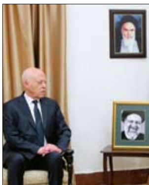
■ رئیس جمهور تونس ضایعه در گذشت رئیس جمهور و وزیر امور خارجه و همراهان ایشان را تسلیت گفت