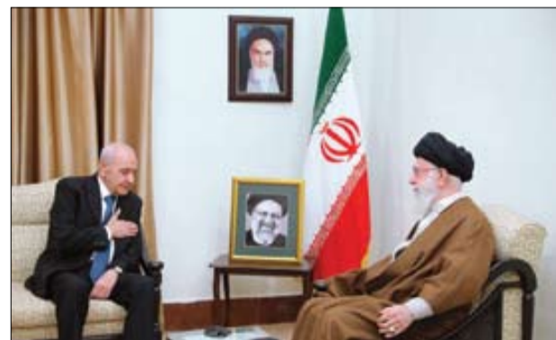
■ «نبیه بری» رئیس مجلس لبنان به نمایندگی از دولت و ملت این کشور، ضایعه در گذشت رئیس جمهور و وزیر امور خارجه و همراهان ایشان را به حضرت آیت الله خامنه ای و ملت ایران تسلیت گفت