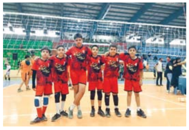
شهید محمدمهدی ایرانمنش در تیم والیبال فوتبالن اختیار آباد