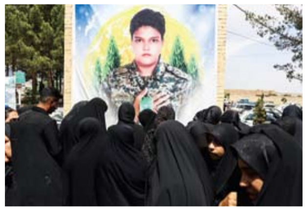
تشییع شهید محمدمهدی ایرانمنش

آخرین کتابی که همسر چند روز قبل از شهادتش آن را مطالعه کرد، کتاب «سرباز وطن» حاج قاسم سلیمانی بود و آنقدر او از این کتاب در خانه تعریف کرد که همه مشتاق خواندن این کتاب شده بودند. خوش به حال او که سرباز حاج قاسم شد. خوش به سعادتش که به جمع رفقای شهیدش ملحق شد. ما لیاقت حضور او را در کنار