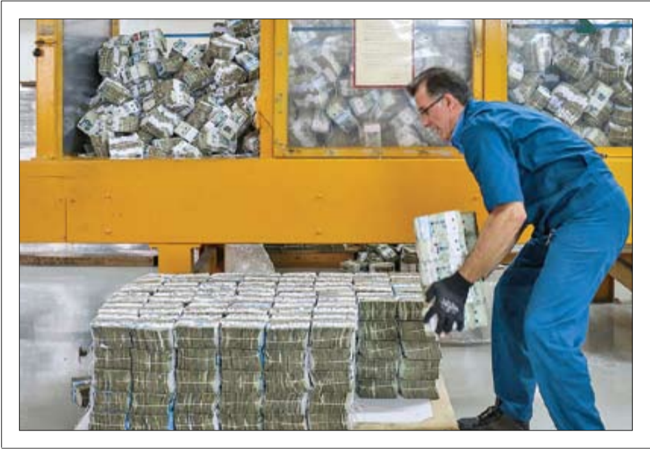
استقراض از بانک مرکزی

تأمین هزینه‌ها بدون چاپ پول با تکیه بر درآمدهای مالیاتی یکی از دستاوردهای بزرگ رئیسی است