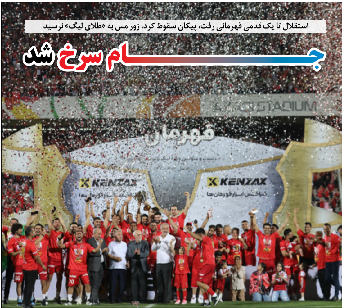
استقلال تا یک قدمی قهرمانی رفت، پیکان سقوط کرد، زور مس به «طلای لیگ» نرسید

رئیس‌جمهور امریکا از جزئیات یک طرح توافق سه‌مره‌ای جنگ غزه رونمایی کرد که به گفته او اسرائیل آن را عرضه کرده و می‌تواند منجر به آزادی اسیران و همچنین پایان حدود هشت ماه جنگ شود؛ طرحی که البته اسرائیلی‌ها شایع‌چندانی در مورد نحوه بیان آن از طرف بایدن ندارند، در حالی که حماس آن را «مثبت» خوانده است. جو بایدن گفته در