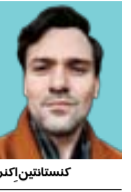
کنستانتین کاترین ESPN